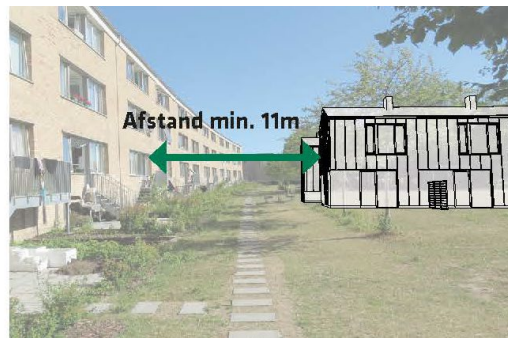
Billede af haverum hvor bygherre ønsker at placere syv rækkehuse på tværs i haverummet samt skitse af rækkehuse placeret i haverummet. Illustration: SLA og Vandkunsten