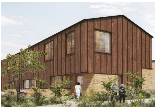
Et eksempel på rækkehuse, som er i overensstemmelse med lokalplanen. Illustration: SLA og Vandkunsten.