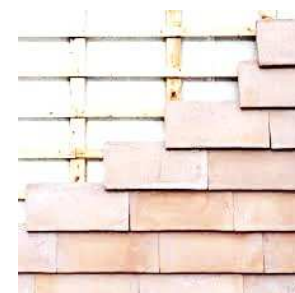
Skærmtegl som shingles