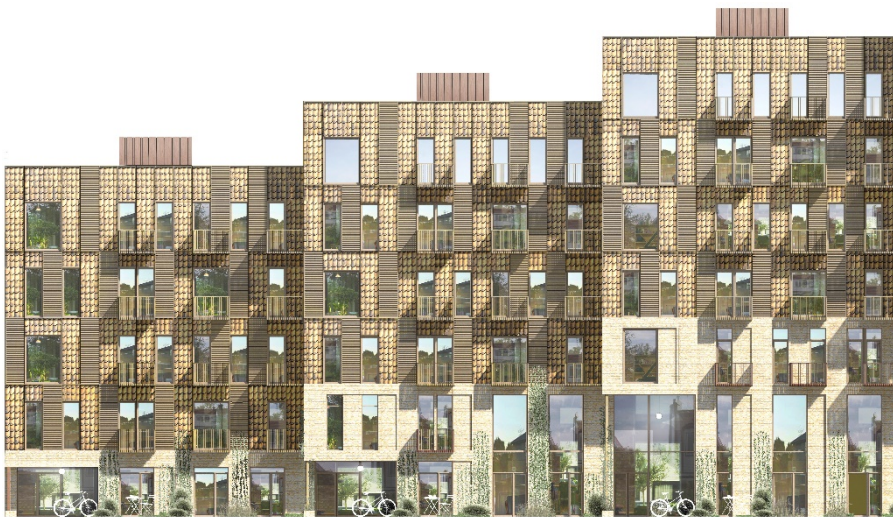
Billede af facadeudsnit af byggeri i delområde I med gule teglskaller, træ og gul muret base.

hvordan dette foreslag ville se ud. Byggeriet udgør et meget stort bygningsvolumen, og den ene bygning er ca. 200 m lang og op til 30 meter høj. Ved at byggeriet i lokalplanen kræves opført med tegl lagt som shingels sikres en dybde i facaden, skyggevirkning og opdeling af facaderne i mindre felter, så bygningens facade får en variation og nedbrydes i skala. Det store byggeri opdeles på den måde i en base-facade og en facade over basen. Disse bestemmelser vil ikke kunne gælde for gule tegl i blank mur, som byggherre foreslår, da de giver et andet udtryk og forudsætter en anden bearbejdning og helt andre facadebestemmelser. Alternativt kan byggherre og boligorganisationerne fremsende illustreret materiale i forbindelse med den offentlige høring, der evt. kan udsendes i supplerende høring, og indgå i den politiske behandling ved den endelige vedtagelse af lokalplanen.