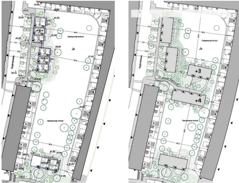
Bebyggelsesplan for ét af de to haverum henholdsvis uden og med bebyggelse inde i haverummet. Illustration: SLA og Vandkunsten

Bygherre og boligorganisationerne forventer at opføre ca. 210 rækkehuse, i primært 2 etager, og 210 boliger i etagebyggeri i lokalplanens første etape. De ønskede 14 rækkehusboliger i to etager, vurderes af forvaltningen ikke som afgørende for andelen af nye boliger i området, men uhensigtsmæssige ift. områdets bevaringsværdier og beboernes brug af fællesarealerne.