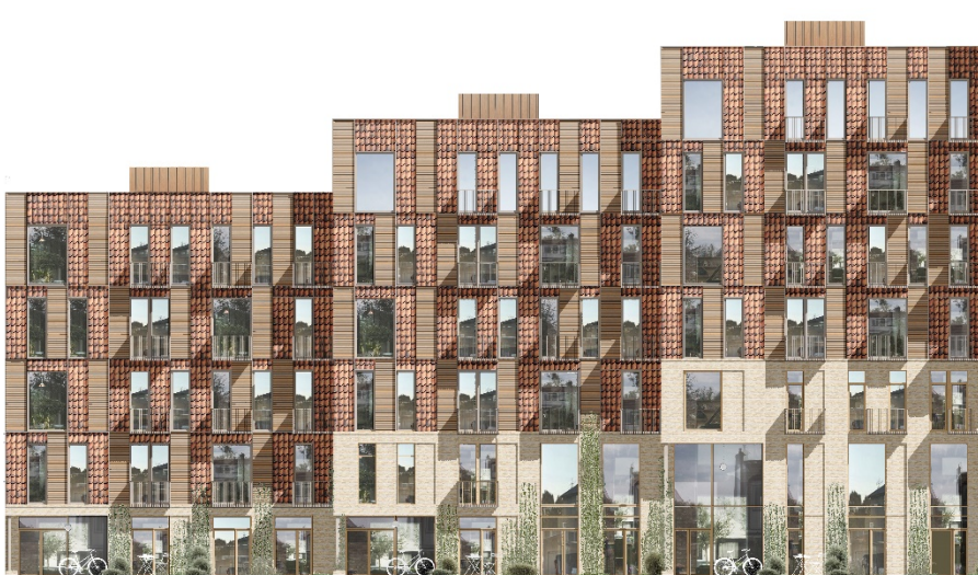
Billede af facadeudsnit af byggeri i delområde I med røde teglskaller, træ og gul muret base.