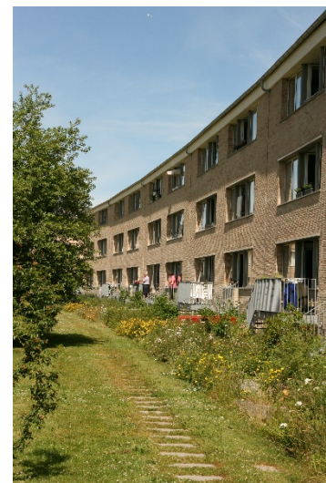
På billedet ses haverum med bygning der buer, hvilket er karakteristisk for de to haverum.

De åbne grønne haverum er en væsentlig årsag til at bydelen er udpeget som værdifuldt kulturmiljø, som et godt eksempel på velfærdsbyggeri. Forvaltningen vurderer, at byggeri inde i de to haverum vil dele haverummene op på en uhensigtsmæssig måde. Herudover vurderer forvaltningen, at en placering af rækkehuse på tværs af haverummene kan give en uheldig privatisering af haverummene, da meget areal vil blive brugt til bygninger, brand- og adgangsarealer samt kantzoner til de private rækkehusejere, og vil bryde med det generelle princip i planen, om ikke at bygge på tværs inde i haverummene. Princippet er, at sikre gode funktionelle fælles gårdrum.