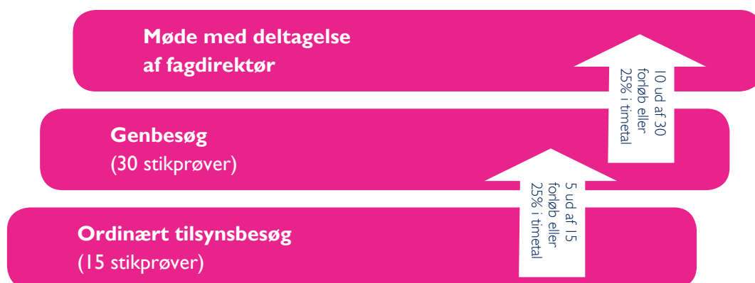
FIGUR 1: ESKALATIONSMODEL VED KONSTATERING AF MANGLENDE TIMELEVERANCER

Konstaterer Københavns Kommune uoverensstemmelse mellem de bestilte timer, og de timer, der har været planlagt for borgeme i forløb hos jer, og I ikke skriftligt kan dokumentere gyldig grund hertil, vil der blive rejst tilbagebetalingskrav svarende til timedifferencerne. Differencer svarende til mere end 25 pct. af de bestilte timer i stikprøven, eller differencer i mere end en tredjedel af de gennemgåede forløb, vil altid udløse et genbesøg inden for seks måneder.