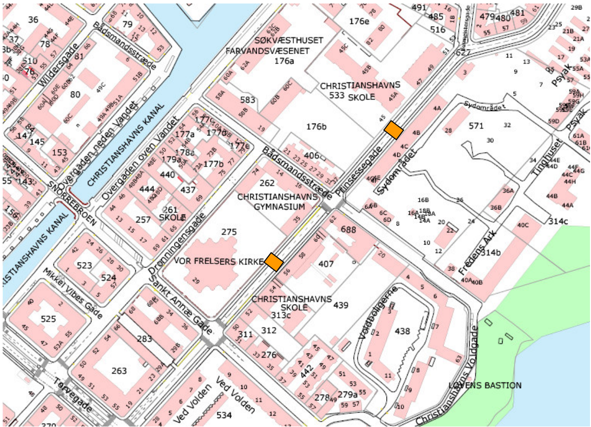
Omtrentlig placering af midlertidige bump på Prinsessegade.