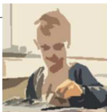
Figur 2: Borger-eksempler på indsatser omfattet af det tværgående højt specialiserede socialområde og specialundervisningsområde.