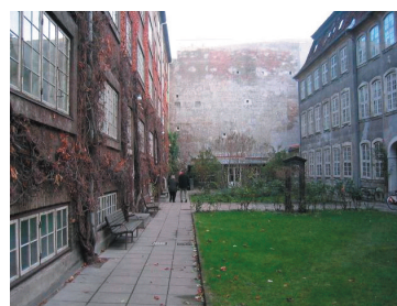
Den Harboeske Stiftelse