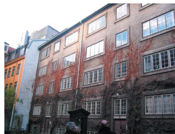
Den Sierstedske Stiftelse