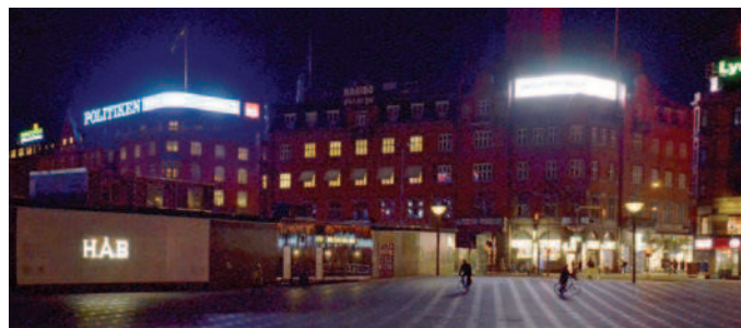
Lysviserne ved Rådhuspladsen er et bidrag til stedets puls. Det er afgørende, at især de digitale lysreklamer reguleres efter lysforholdene om dagen og om aftenen.