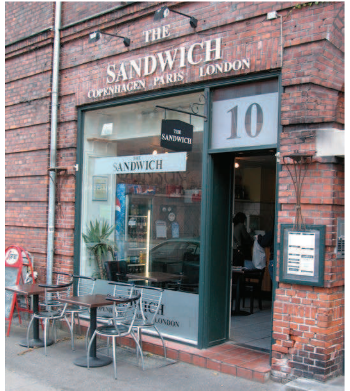
Her har man opnået en fin harmoni mellem skiltningen og bygningens facade med dens materialer og detaljer.