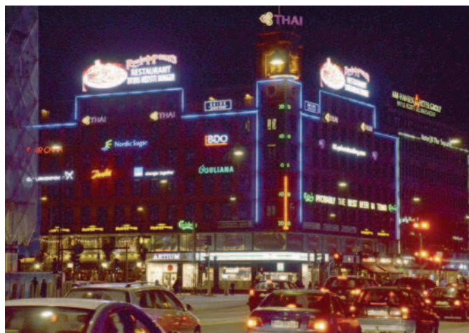
Det er vigtigt, at de forskellige reklamer og skilte indordner sig i en helhed uden at overdøve hinanden.