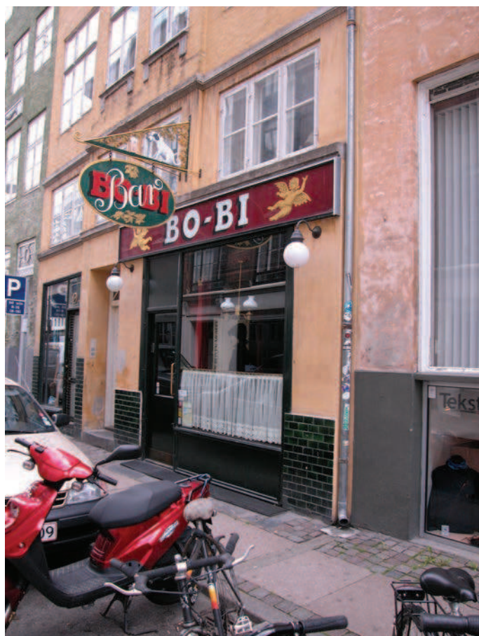
Skiltningen formidler på en enkel måde, hvad der forhandles, samt butikkens navn på en måde som er fint tilpasset kvarterets arkitektur.

Det er afgørende for en god skiltning, at forbrugeren ikke forvirres af for mange informationer. Skiltningen skal derfor være enkel, klar og tydeligt formidle, hvad der forhandles. Skiltningen må gerne være fantasifuld og af høj kvalitet, hvad angår design og udførelse.