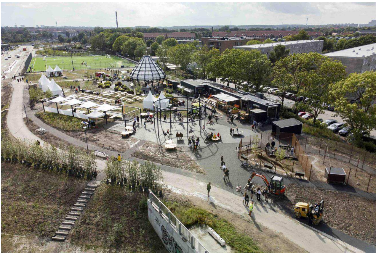
Kulbaneparken i Valby, udviklet i samarbejde med beboere, frivillige og aktører i nærområdet gennem Områdefornyelsen Kulbanekvarteret fra 2016-2021.

De nye forbindelser har gjort at flere færdes gennem Kulbaneparken til dagligt, mens nye samlingssteder har gjort bylivet mere levende.