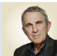
FHV. folketingsmedlem Steen Gade

Han er en kendt taler på internationale konferencer og bl.a. æresmedlem af International Water Association.