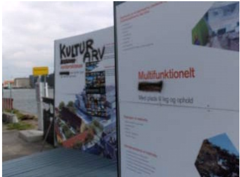
Udstillingen på grunden har flere gange været udsat for hærværk

Der er derudover igangsat et samarbejde om aktivering af grunden med kunstnergruppen Parfyme under kunstkvadrientalen U-turn. Dette samarbejde skal pågå på grunden, hen over sommeren.