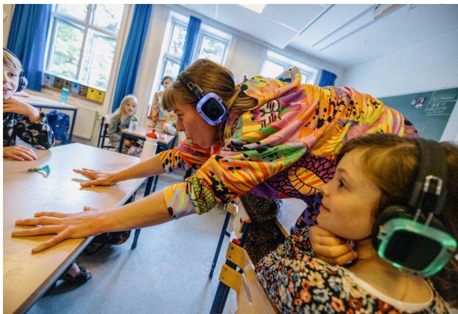
PR-billede fra forestillingen Blækspruttetanker af Boaz Barkan.

Programmet sætter fokus på ungekulturen og tilbyder nye kreative fællesskaber for de unge, som er interesserede i dans. Dansen vil udfordre de unge på andre måder, end de klassiske forenings- og klubaktiviteter.