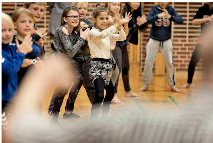
Fra forestillingen Os To.

I denne ansøgning søger vi om 150.000 kr. i tilskud til en projektleder til at lede og koordinere den nye børn- og ungestrategi for dans og koreografi i Københavns Kommune og 1,1 mio. kr. til at udvikle og afholde Koral Festival i årene 2025-27.