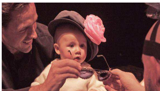
Fra forestillingen Rock Me Baby.