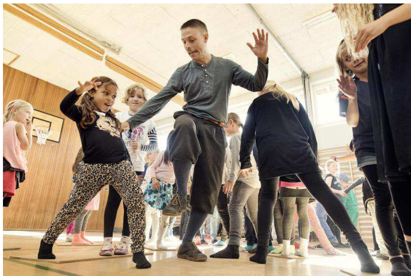
Fra forestillingen Domino Effekten af Rapid Eyes.

Dansehallerne har, gennem sine 20-års erfaring i at arbejde med børn og unge, en stor viden om, hvordan man udvikler og tilrettelægger sine aktiviteter, så de får disse afledte effekter.