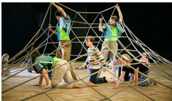
Billede af forestillingen Net.

Net inviterer til, at vi oplever os selv om led i en større kæde, tråde i et net eller atomer i et molekyle. Et net flytter ind og breder sig ud i gymnastiksalen på jeres skole. Ud fra nettet bygger vi et bølgende landskab op, der med dansen som drivkraft åbner døre til nye rum, hvor fantasien får plads. Med undrende nysgerrighed kan vi i nettet se os selv som en del af nye sammenhænge, som hele tiden forandrer sig. Ud af et virvar af tråde danser vi med fantasien på en særlig bane, nye perspektiver dukker op og endnu ukendte rum åbner sig undervejs. Net er skabt af danser- og koreografduoen OR/ELLER.