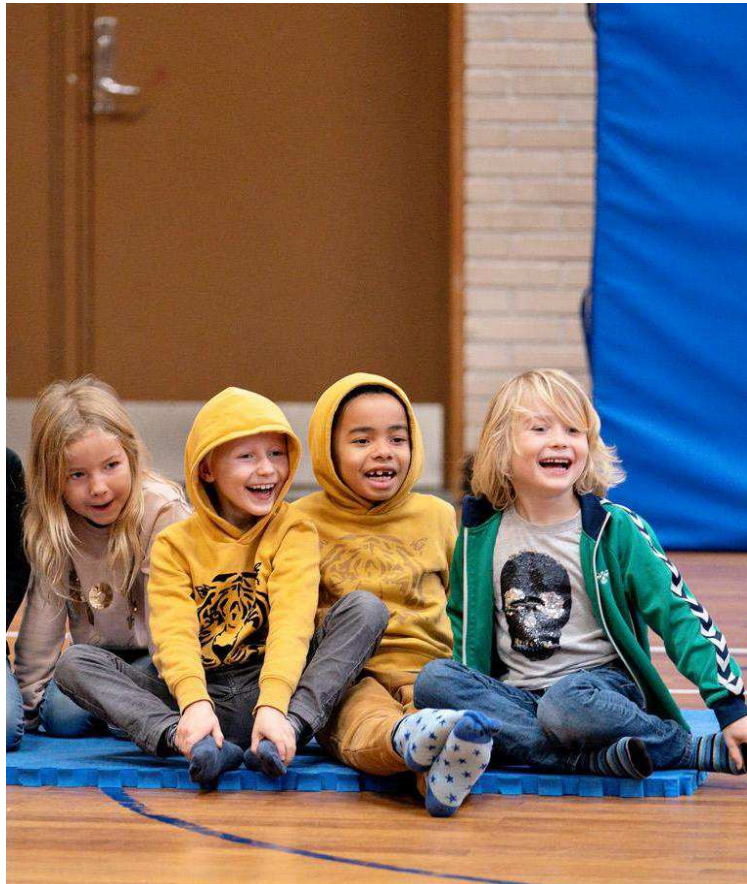
Fra forestillingen Matta Matta 2.0 af The 100 Hands.