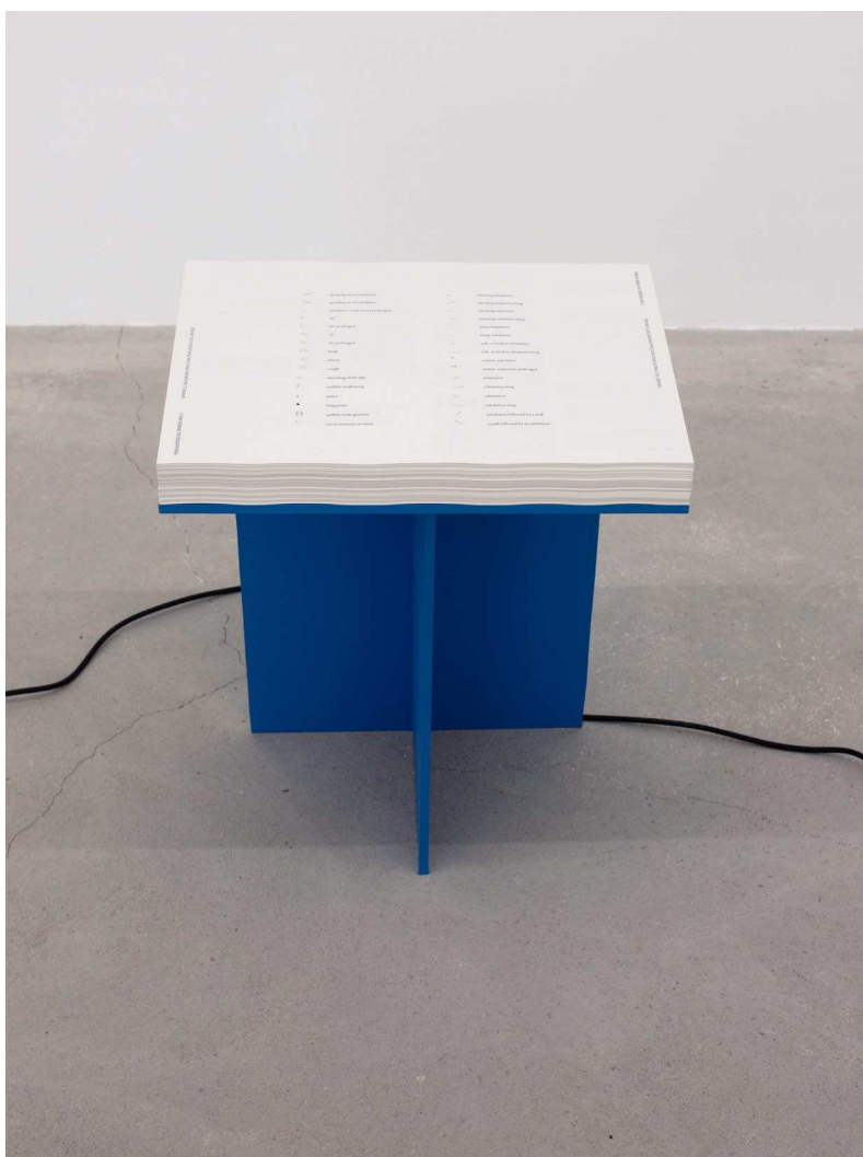
Paralingual Index no. 1

Print på papir, 300 stk., bord. Variable dimensioner. Galleri Arnstedt, Östra Karup, 2024