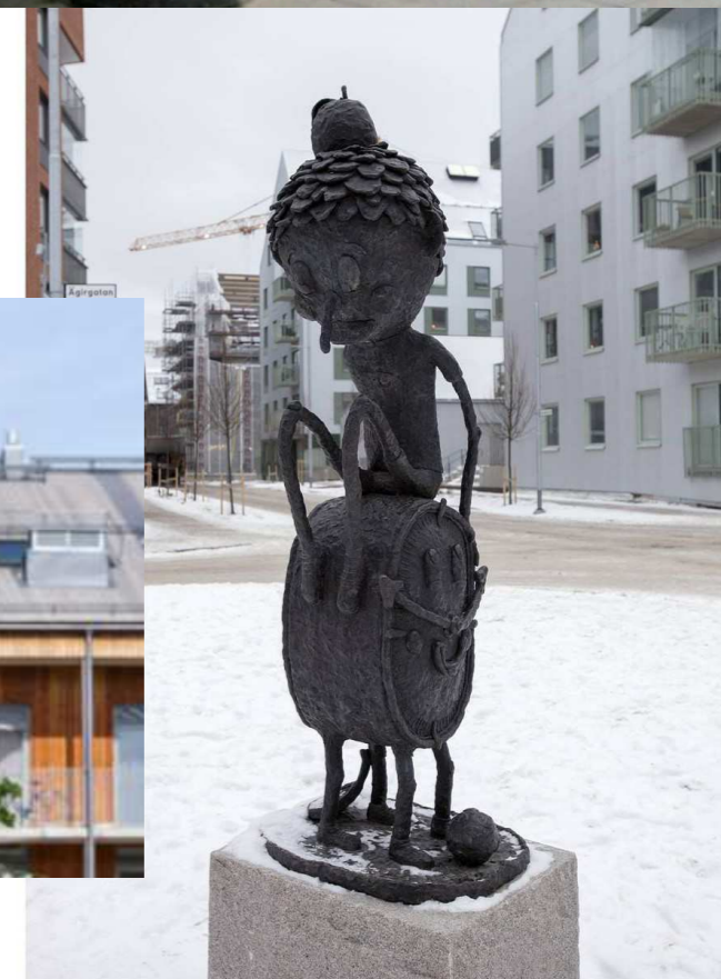
Ojanen Tidsresenären Västerås