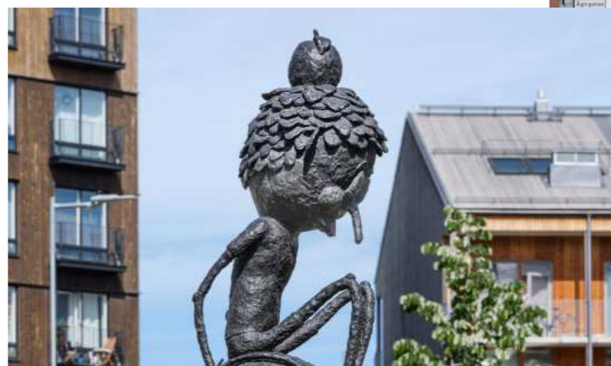
Ojanen Min Plats Västerås