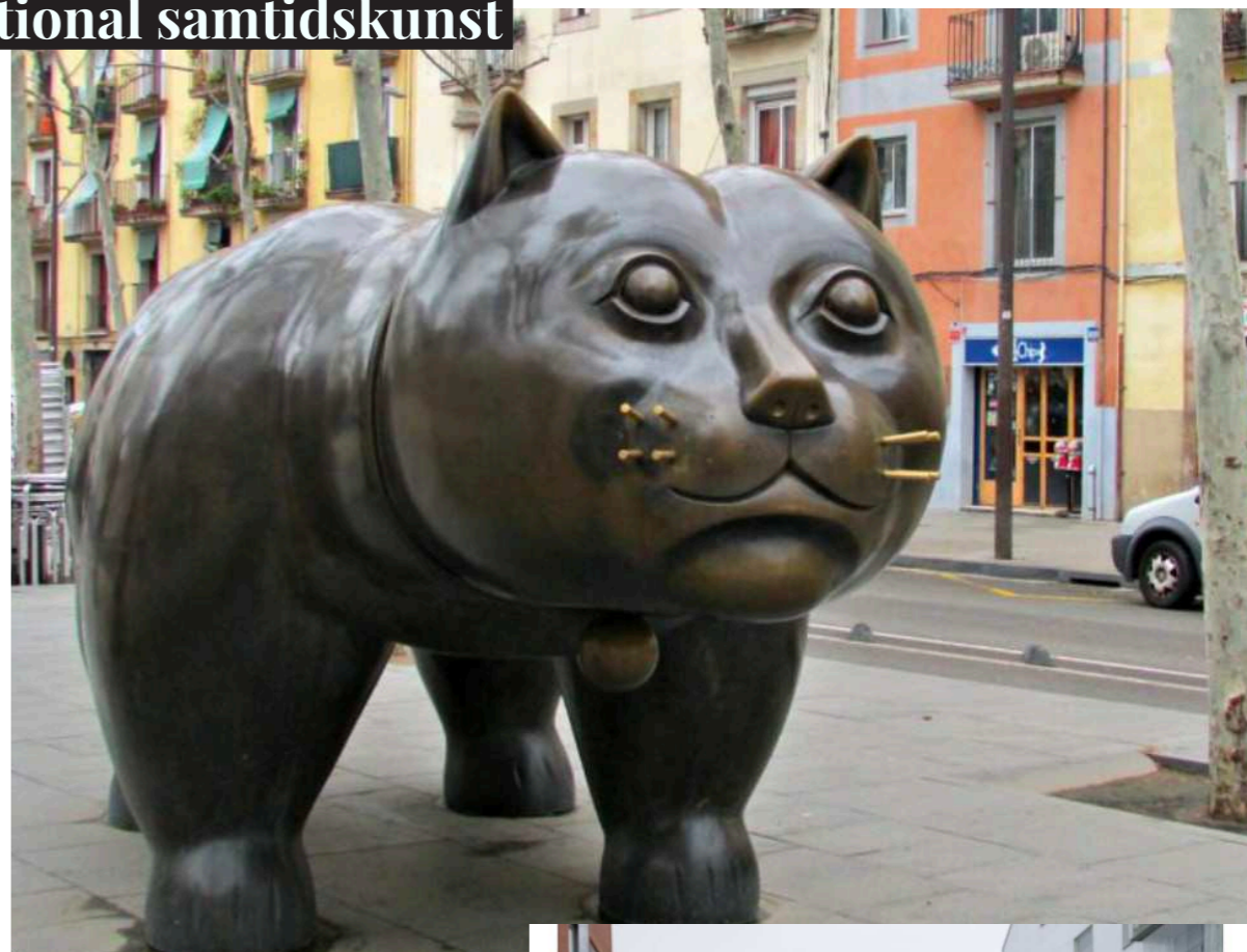
Botero El Gato Barcelona