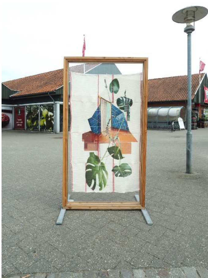
I galskab: fotocollage trykt på gulvklude, 200x90 cm, 2023.