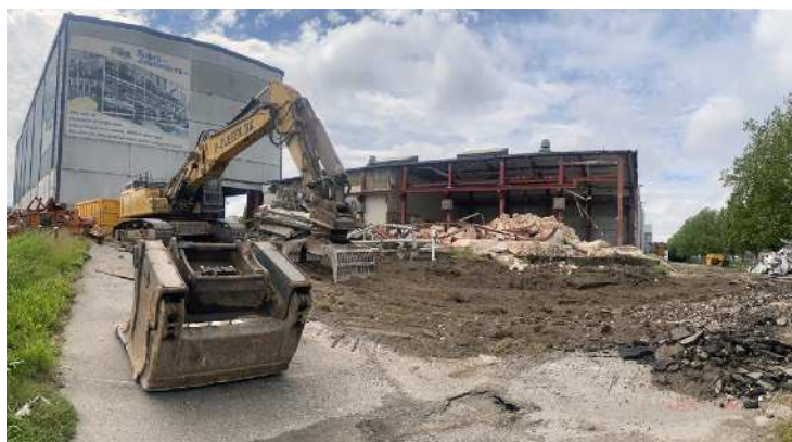
Foto, nedrivning. p.t, af Suhrs Autogenbrug, Strandlodsvej, Amager, 2024