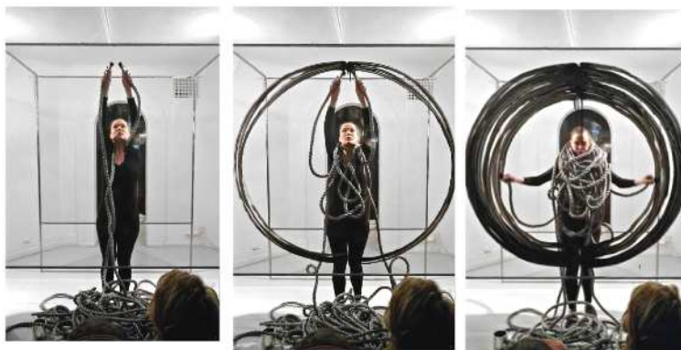
"Parentheses" , performance C4 projects, Kbh, 2020