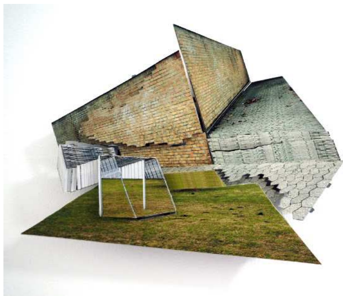
“Parcelhus” skitse 3D fotocollage 35x30 cm, 2023.