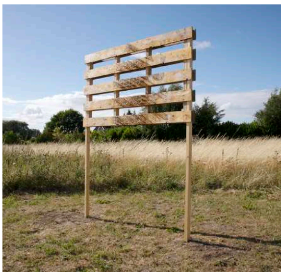
“A LAND NEEDS YOUNG BLOOD” Euro palle, trælægter. Skruer, glitter, Spirefestival, 210BX245HX40B cm 2022. Værket er inspireret af tuse Næs kommunale udviklingsplan der ønsker at gøre Tuse Næs til et attraktivt område for yngre familier. Ligesom det et udbredt ønske fra kommuners side at få mere liv i landdistrikter