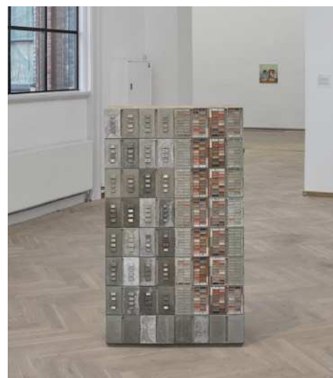
The Concept of the Megastructure New Typologies #1. Beton, make-up, pigment, fliseklæb, træ, 140 X 79.5 X 35 cm, 2022.

Værket reflekterer over strategien 'make-up'. Det indgår i udstillingen som arkitektonisk møblement, mock-up og forstadstypologi, inspireret af facaderne på almene boligblokke fra 1960'erne og 1970'erne.