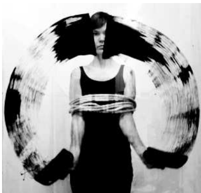
Tied Up , selvportræt, foto (2018).