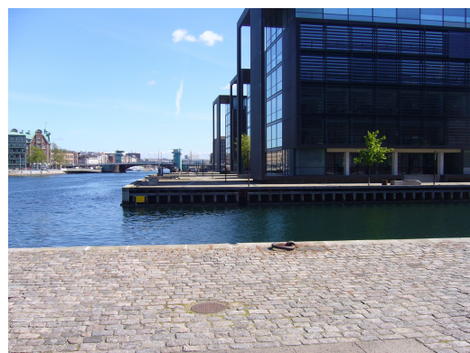
Foto 2. Christianshavns Kanals sydligste udløb i Inderhavnen

Fordelen ved denne placering er, at broen bliver en naturlig forlængelse af havnepromenaden og ”lukker” dermed hullet, som