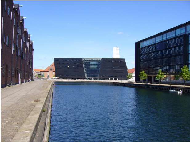
Foto 3. Christianshavns Kanal og det frie kig til Den Sorte Diamant

Broen kan komme til at virke som en barriere i forhold til det frie kig til den Sorte Diamant (se foto 3) eller fra den Sorte Diamant ned at Christianshavns Kanal. Beliggenheden bør animere til en arkitektonisk flot bro men samtidig en "let" konstruktion for at mindske denne barriere.