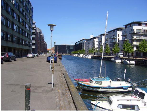
Foto 1. Christianshavns Kanal set mod nordvest

strækning, formentlig fordi de også skal passere under Knippelsbro for at komme ud af Københavns Havn.