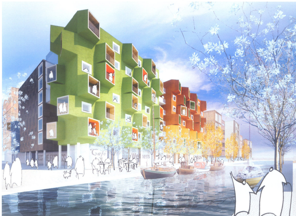
Bygningens nordvestlige hjørne set fra Asker Jorns Alle ved broen over kanalgaden (Roberts Jacobsens Vej).

Projektet vil i den videre bearbejdning til sin endelige form blive forbedret yderligere i samspil mellem bygherren, rådgiverne, Center for Bydesign og Sundheds- og Om-sorgsforvaltningen.