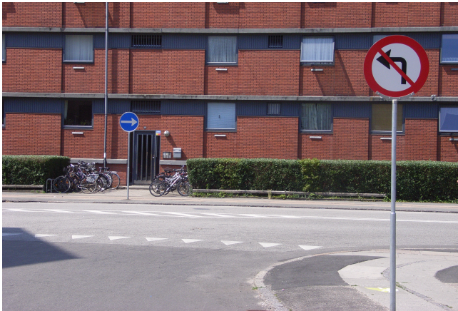
Foto 2. Restriktioner i krydset Nannasgade/Hamletsgade set fra Nannasgade

Lukningen af Mimersgade skal fremme målene Trafik- og Byrumsplan for Mimersgadekvarteret og dermed bidrage til at fjerne den gennemkørende trafik i området, som er blevet større efter etablering af trafikforsøget på Nørrebrogade. For de lokale beboere og virksomheder, der benytter bil og før har brugt Mimersgade og Hamletsgade som adgangsvej, betyder forsøget, at det bliver lidt vanskeligere at komme til og fra området.