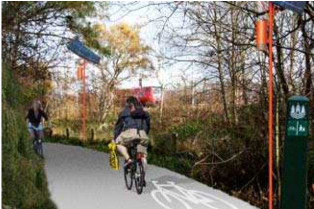
En belagt og belyst sti gennem Ryvang Naturpark mellem søen og jernbanen