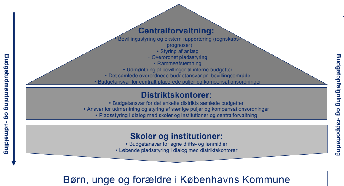
Figur 2 Budget- og rapporteringsansvar

Budgetansvaret, forstået som ansvaret for at sikre at den udmeldte budgetramme overholdes i regnskabsåret, er et omdrejningspunkt i forvaltningens økonomistyring. Der skal skelnes mellem forskellige former for budgetansvar, nemlig: