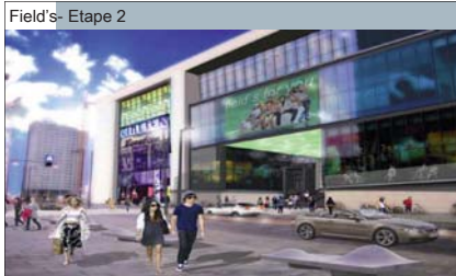
Illustration fra Field's

Steen & Strøm Danmarks vision for Field's er baseret på visionerne i Daniel Libeskind's masterplan for Ørestad City, som blev udarbejdet i 2006.