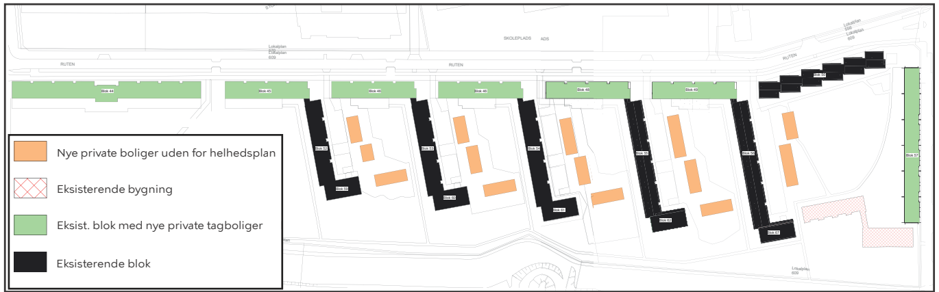
Fremtidigt bebyggelsesmønster i SAB Tingbjerg afd. II og III.