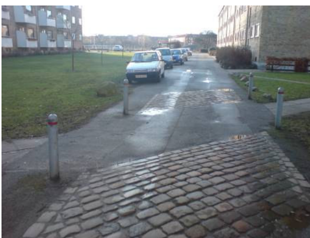
Figur 2. Passagen mellem karréerne med vejdlæg samt de 4,5 meter brede vejpassager mellem bebyggelserne.