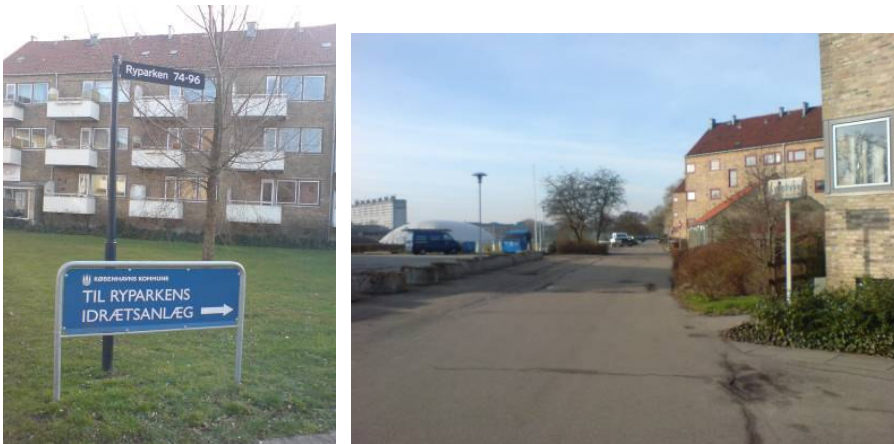
Figur 1. Nuværende skilte med henvisning til kørsel gennem Ryparkens bebyggelse, nr. 74-96. Til højre ses vejen der fører frem til Lyngbyvejens lokalgade. Gaden har skråparkering i sydsiden.