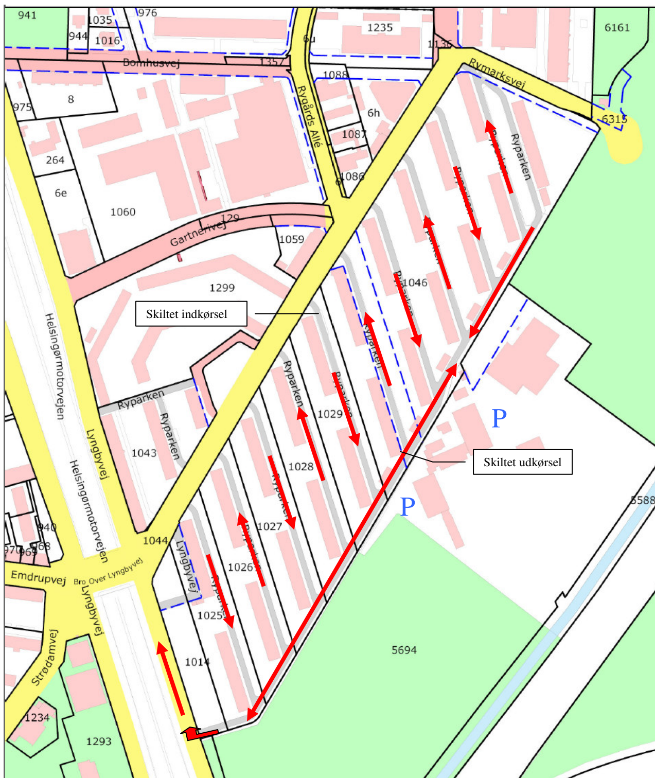
Figur 3. Nuværende trafikale struktur vist med røde pile. Den blåstiplede linie markerer fremtidige vejudlæg. Grå veje er internt færdselsareal.