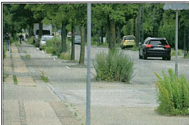
Fra Venstre Lokaludvalg