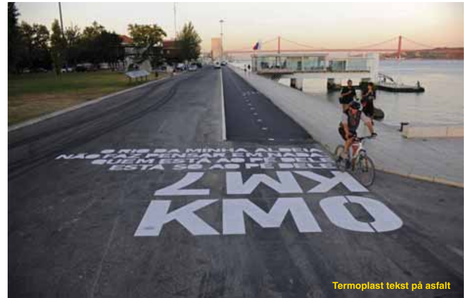
Termoplast tekst på asfalt