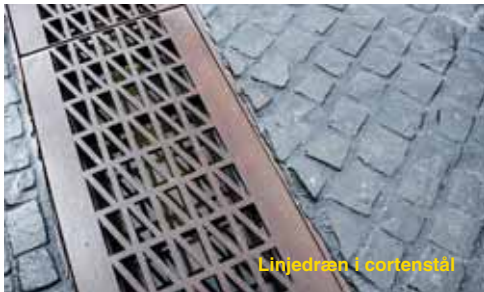
Linjedræn i cortenstål