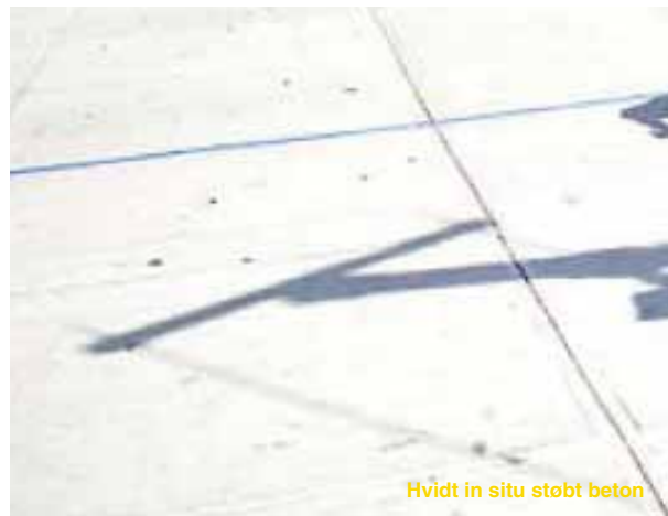
Hvidt in situ støbt beton