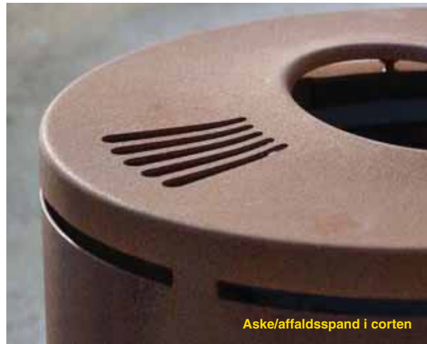
Aske/affaldsspand i corten