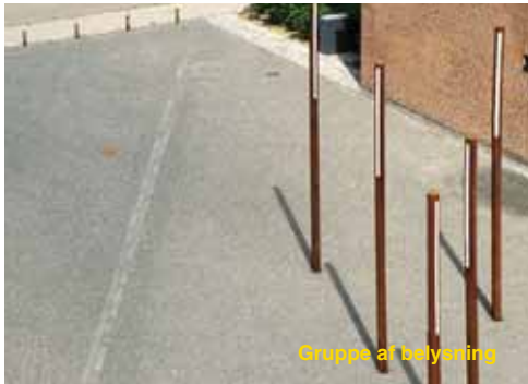
Gruppe af belysning