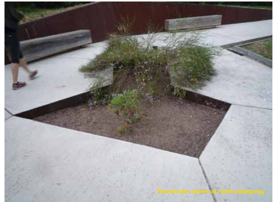
Plantehuller skåret ud i betón belægning