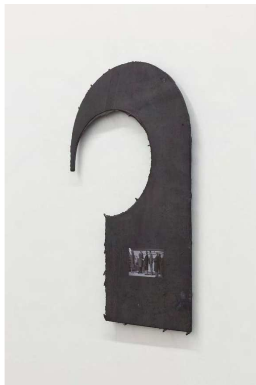
Black Hook Tarmac B&W (2020), Anodiseret aluminium, UV print, 48 x 30 cm