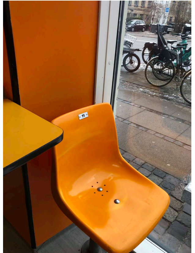
Udstillingsteder: Vaskerier; Øster Farimagsgade & Rantzausgade