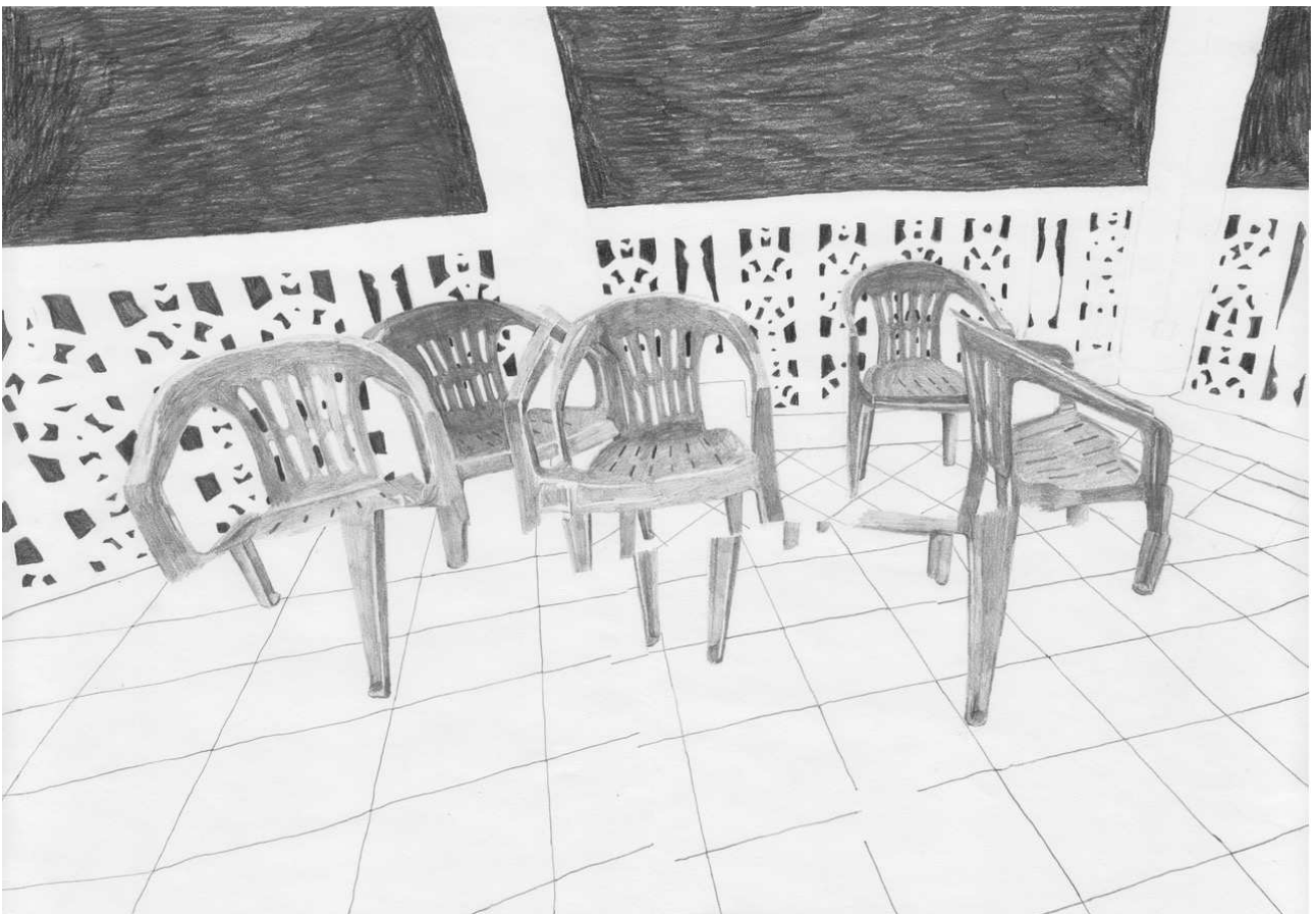
Uden titel, 2019. Blyant på papir, 297 x 420 mm.