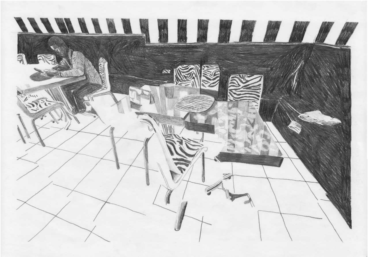
Uden titel, 2019. Blyant på papir, 297 x 420 mm.