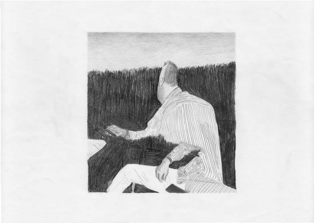
Mand ved hæk , 2019. Blyant på papir, 297 x 420 mm.