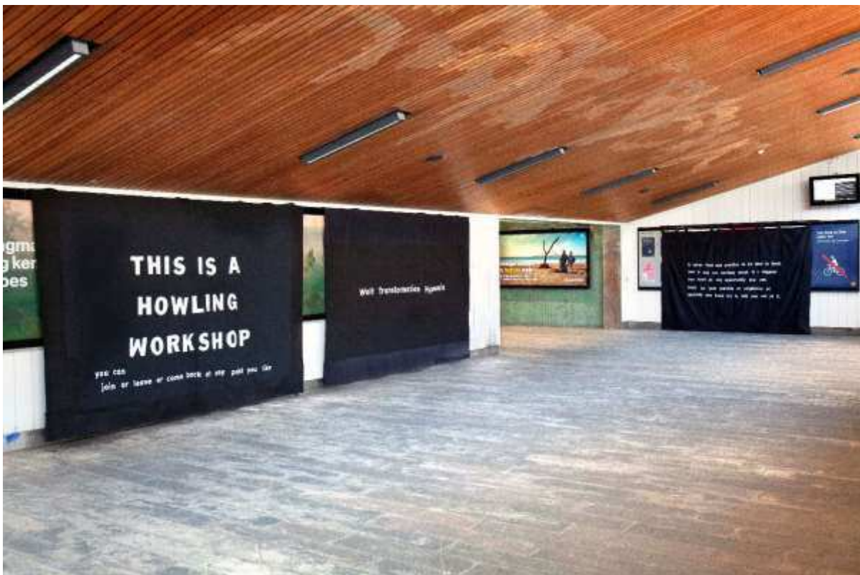
Scenografi med banners i tidligere performance, Udstillingsstedet Sydhavn Station, København