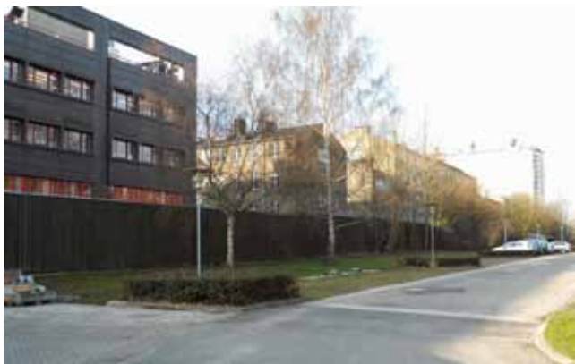
Virksomheden Sahva, Borgervænget 5-7.

sen vil være sundhed og bevægelse, hvor indsatserne vil centrere sig om at skabe et mere aktivt og mangfoldigt kvarter. Det vurderes, at disse intentioner vil understøttes gennem fastlæggelse af mere alsidige anvendelsesmuligheder i området.