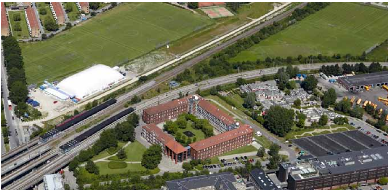
Luftfoto af planområdet og dets omgivelser.