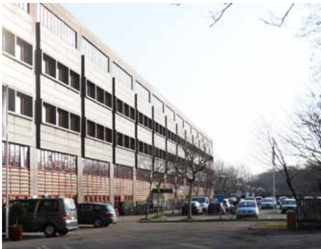
Virksomheden Sahva, Borgervænget 5-7.

bygningshøjde på 24 meter. Området har yderligere en stjernebestemmelse, der tillader butikker i overensstemmelse med bemærkningerne i kommuneplanens rammeafsnit, rammeopslaget for Østerbro, samt retningslinjerne for Lyngbyvejs Bydelscenter.