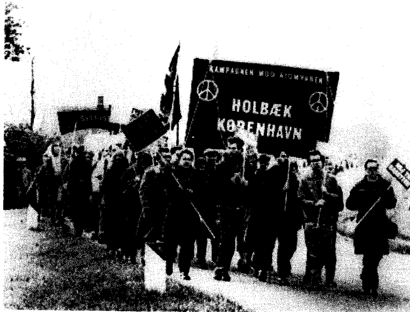
Golden Days 2011 og 2012: