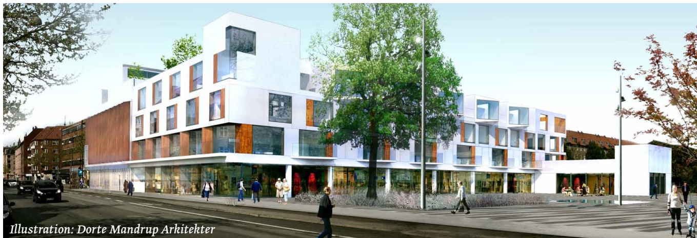
Illustration: Dorte Mandrup Arkitekter

med materiale af beton, træ og glas. Hertil kommer forskellige virkemidler som karnapper, variation i etagehøjde og siddnicher i stueetagen for at skabe variation og reliefvirkning i facaden.