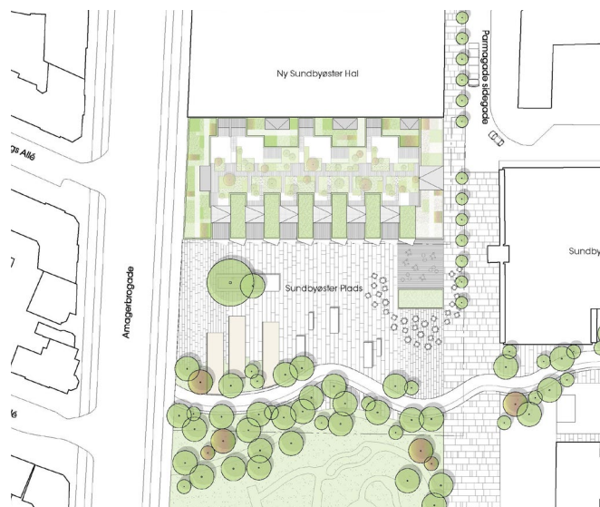
Situationsplan: Dorte Mandrup Arkitekter

Om byrummene står der blandt andet, at 'Sundbyøster Plads ønskes styrket som et velfungerende torv for hele kvarteret. Den nuværende plads er for stor og udflydende og bruges kun i mindre grad. Helhedsplanen foreslår,