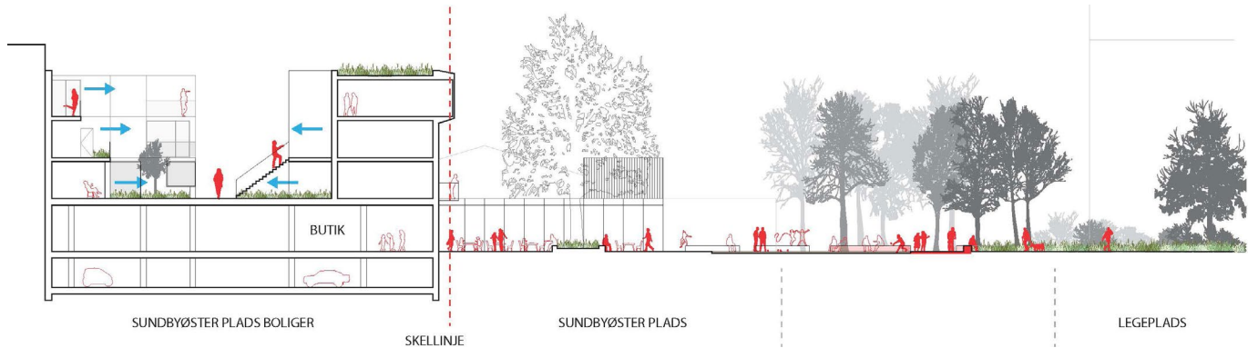
Snit, der viser fremtidige byggemuligheder og Sundbyøster Plads i foreslået lokalplantillæg. Illustration: Dorte Mandrup Arkitekter