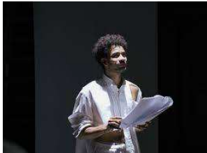
Readings Dark Matters 2024