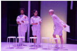
Readings Dark Matters 2024

I løbet af tre dage vil festivalen Black History Month præsentere et tværmedialt og mangfoldigt program for både voksne og børn. Formålet er at skabe en platform for nye perspektiver og fortællinger i dansk teater, med særligt fokus på afro-dramatik, der udforsker identitet, kultur og samfund fra nye synsvinkler.