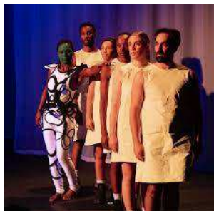
Readings Holberg Goes Black 2022