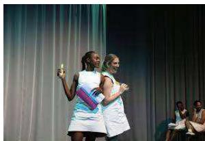
Readings Holberg Goes Black 2022

Projektet er en del af festivalen og integreres dermed i den overordnede PR- og marketingstrategi, som administreres af Outbound Communication. Vores readings er åbne for alle over 18 år og henvender sig ikke kun til branchefolk, men til enhver med interesse for dramatik, teatermagi og scenekunst. Vi stræber efter at skabe en inkluderende oplevelse, hvor alle uanset race, køn eller religion føler sig velkomne og inspirerede.