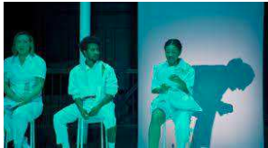
Readings Dark Matters 2024