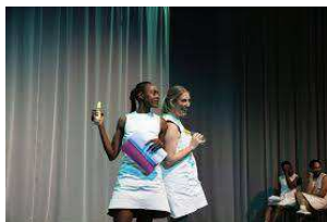
Readings Holberg Goes Black 2022

Projektet er en del af festivalen og integreres dermed i den overordnede PR- og marketingstrategi, som administreres af Outbound Communication. Vores readings er åbne for alle over 18 år og henvender sig ikke kun til branchefolk, men til enhver med interesse for dramatik, teatermagi og scenekunst. Vi stræber efter at skabe en inkluderende oplevelse, hvor alle uanset race, køn eller religion føler sig velkomne og inspirerede.