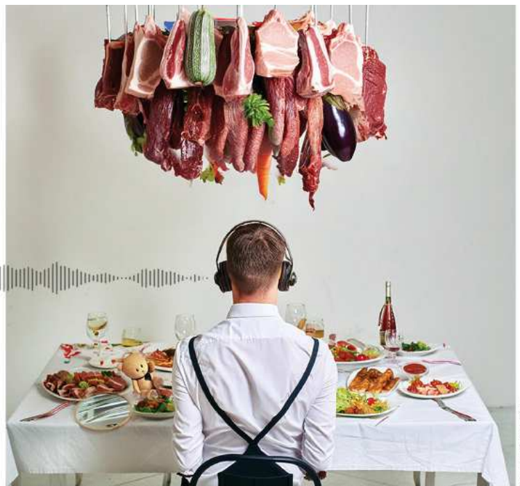
THIS PICTURE WAS MADE WITH AI TO START IMAGINING WHAT CAN HOVER OVER THE HEADS