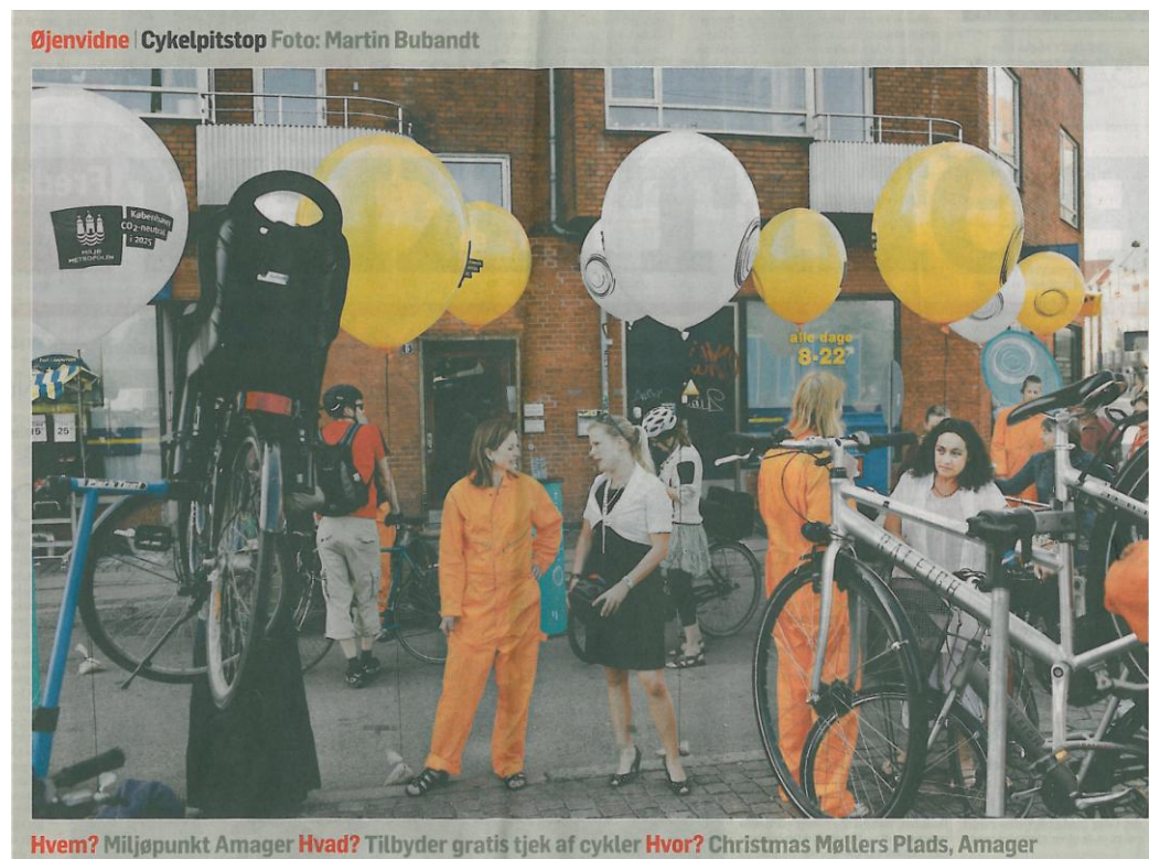
Hvem? Miljøpunkt Amager Hvad? Tilbyder gratis tjek af cykler Hvor? Christmas Møllers Plads, Amager

Med eventen cykel-pitstop fik vi fuld mediedækning med foto i Politiken. Her være gjort meget ud af synligheden og det gav mange gode snakke med cyklisterne.