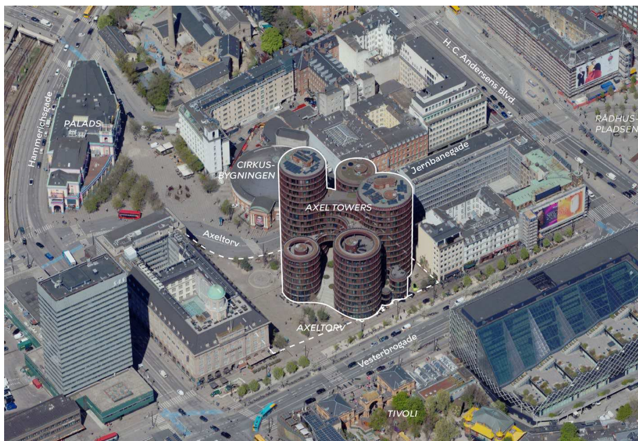
Området set mod nord. Lokalplanområdet er indtegnet med hvid linje, og de vigtigste gader, pladser og bygninger er navngivet.

anvendelsesmuligheden. Derudover vil bestemmelser om beplantning i byggeriets byhave blive bearbejdet.