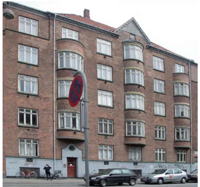
Øverst til højre: Ejendommen set fra hjørnet Kurlandsgade/Sundholmsvej