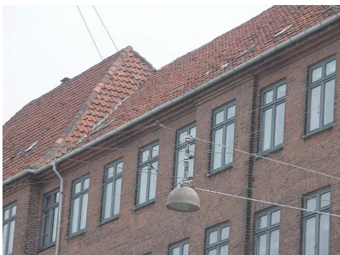
Øverst til højre: Ejendommen set fra hjørnet Sundholmsvej/Telemarksgade