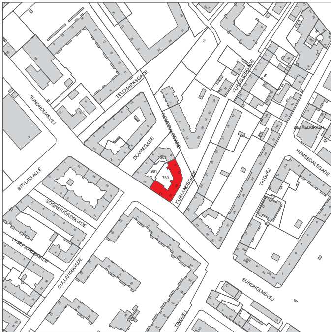
Ejendommen ligger i bydelen Amager Vest