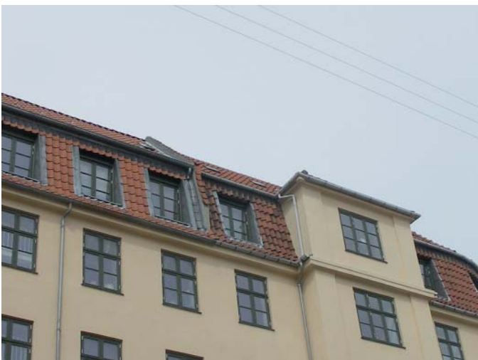
Nederst til høje: Detalje fra tagetage