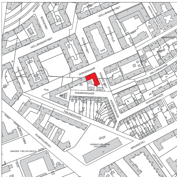
Ejendommen ligger i bydelen Amager Vest