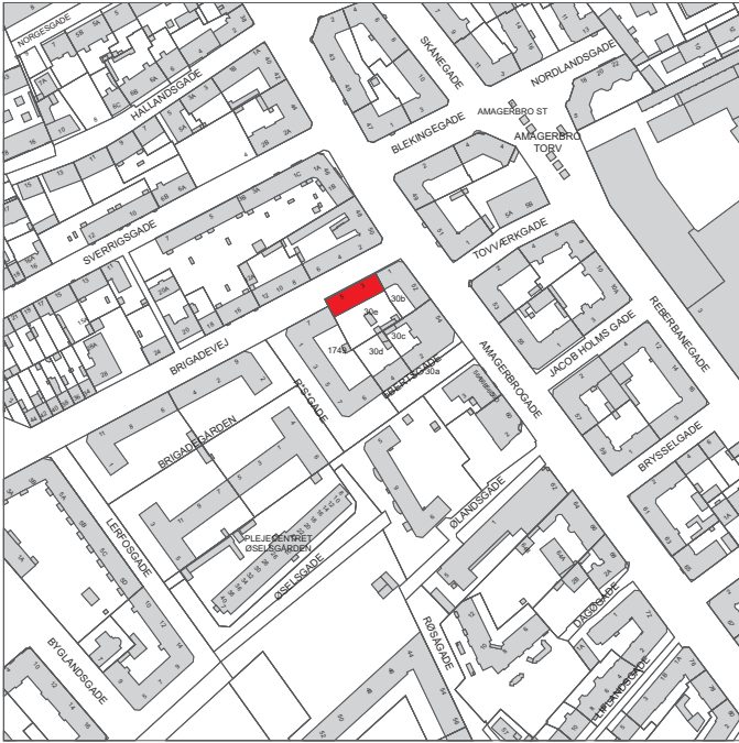
Ejendommen ligger i bydelen Amager Vest