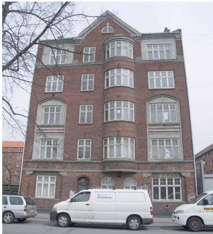
Øverst til højre: Ejendommens facade set fra Sundholmsvej