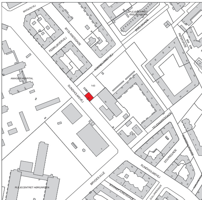
Ejendommen ligger i bydelen Amager Vest