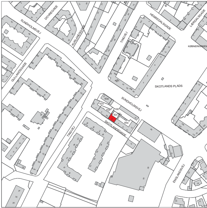
Ejendommen ligger i bydelen Amager Vest