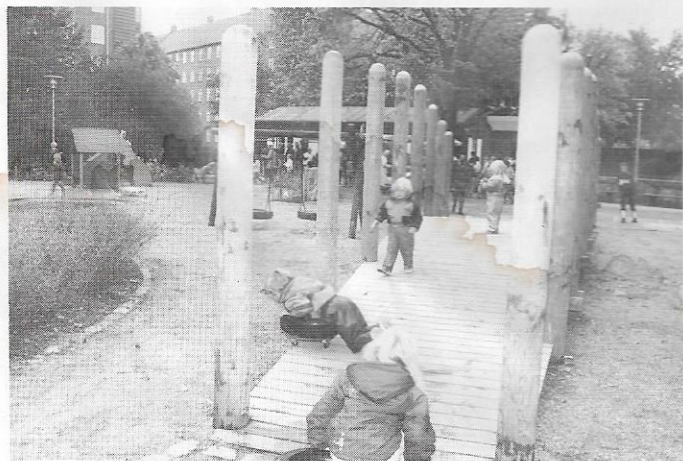
Broen er faktisk smallere på midten. Italiensk model.

åbnet efter at have været lukket i halvandet år, er "besøgstallet" steget til det dobbelte. Der kan godt på almindelige dage være 100 børn ad gangen på legepladsen. En solid succes.