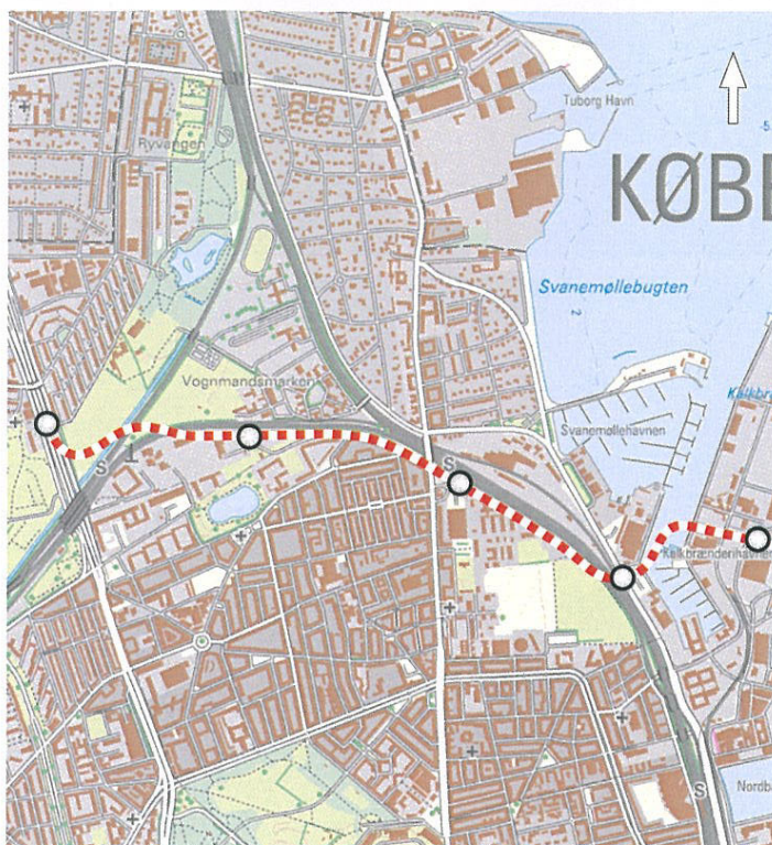
Figur 3. Svanemøllegruppens forslag med markering af vejtilslutninger ved Lyngbyvej, Genbrugsstation ved Borgervænget (option), Svanemøllen Station (option), Kalkbrænderihavnsgade og Nordhavn.

Tunnel forbindelsen starter allerede ved Lyngbyvej, hvor den nordfra kommende trafik mod Nordhavn føres nedad i rampe og i tunnel under Lyngbyvej i stedet for på en bro. Vejen føres under regnvandsbassin, S-baner, Borgervænget, Østerbrogade, videre i tunnel langs den vestlige side af banelegemet samt under banen umiddelbart syd for Svanemølleværket, hvor der er tilslutning til Kalkbrænderihavnsgade. Herefter fortsætter vejen under havnebassin og Sundkrogsgade og ad rampe op til tilslutningsanlæg i den nuværende erhvervshavn.