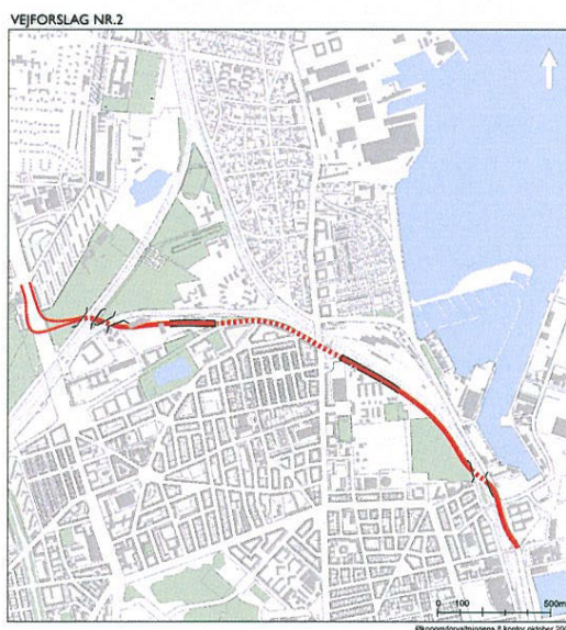
Figur 2. Vejforslag 2. Tunnel er vist stiplet.

Linieføringen for Vejforslag 2 fremgår af Figur 2. Fra Ringbanen fortsætter vejen under Farum banen og herefter i en åben udgravning efterfulgt af en 600m lang strækning i tunnel under Borgervænget og Østerbrogade. Umiddelbart syd for Svanemøllen Station fortsætter vejen i en rampe opad og videre langs den vestlige side af banelegemet. Der er forbindelse til Kalkbrænderihavnsvej ad én eller to viadukter under banen, hvorefter trafik til Nordhavnen og indre by fordeles i lysregulerede kryds ved Sundkrogsgade og Århusgade.