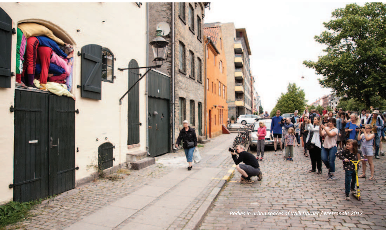
Bodies in urban spaces of Willi Dorner / Metropolis 2017

Vi prioriterer at videreudvikle strategiske samarbejder i byens bydele samt skabe samarbejder i områder, hvor der er underskud af kulturelle tilbud og et reelt behov for forandring.