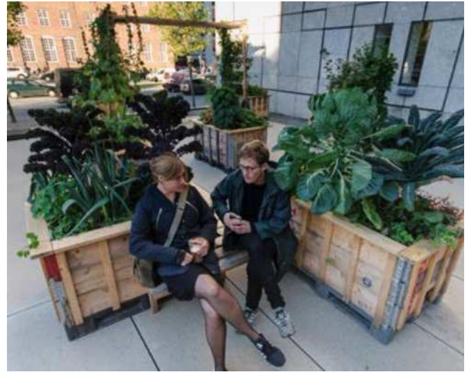
Højbedsmøbel - medium - (uden beklædning)