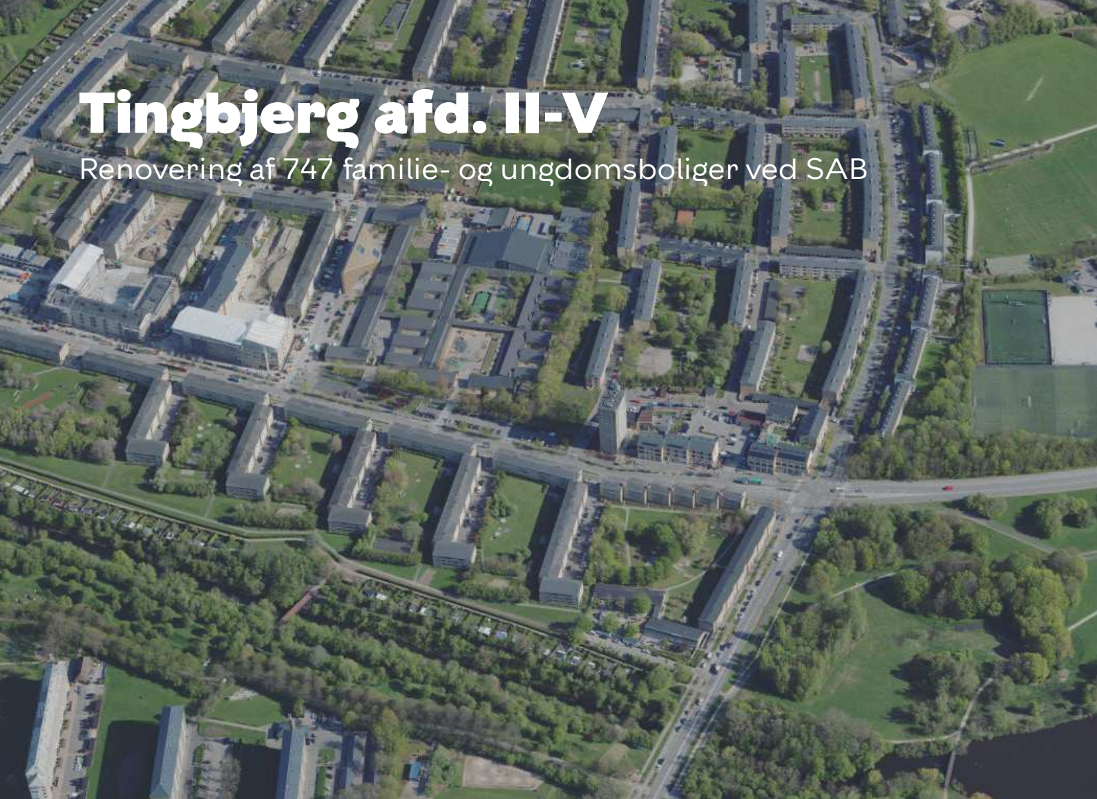
Luftfoto af Tingbjerg set fra syd. I forgrunden Vestvolden og SAB afd. II & III.

Renovering af 747 familie- og ungdomsboliger ved SAB