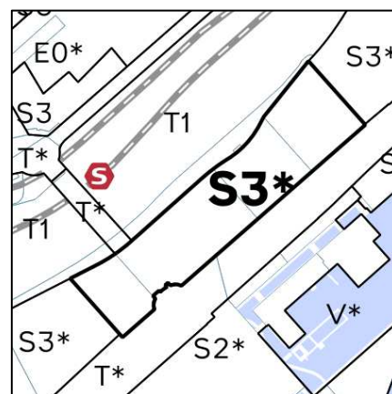
Gældende og kommende rammer i Kommuneplan 2024

Fingerplan 2019 er Miljøministeriets landsplandirektiv for planlægning i hovedstadsområdet. Der er ikke bestemmelser i fingerplanen, der er relevante for dette kommuneplantillæg.