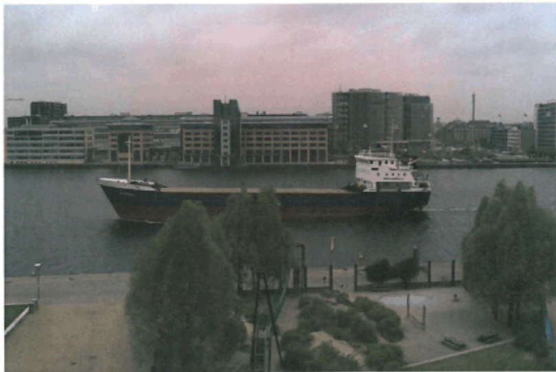
Stor coaster lige ud for Islands Brygge