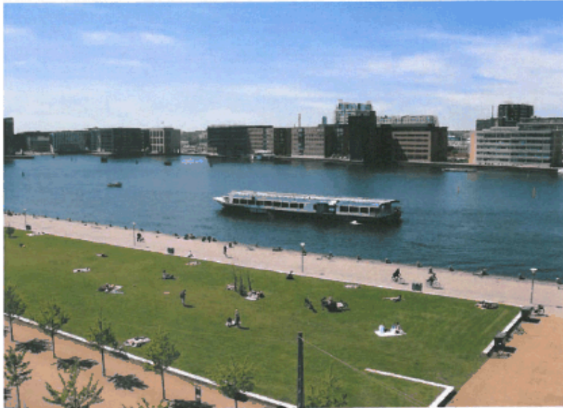
Saga Queen, restaurant- og konference-båd ud for Islands Brygge