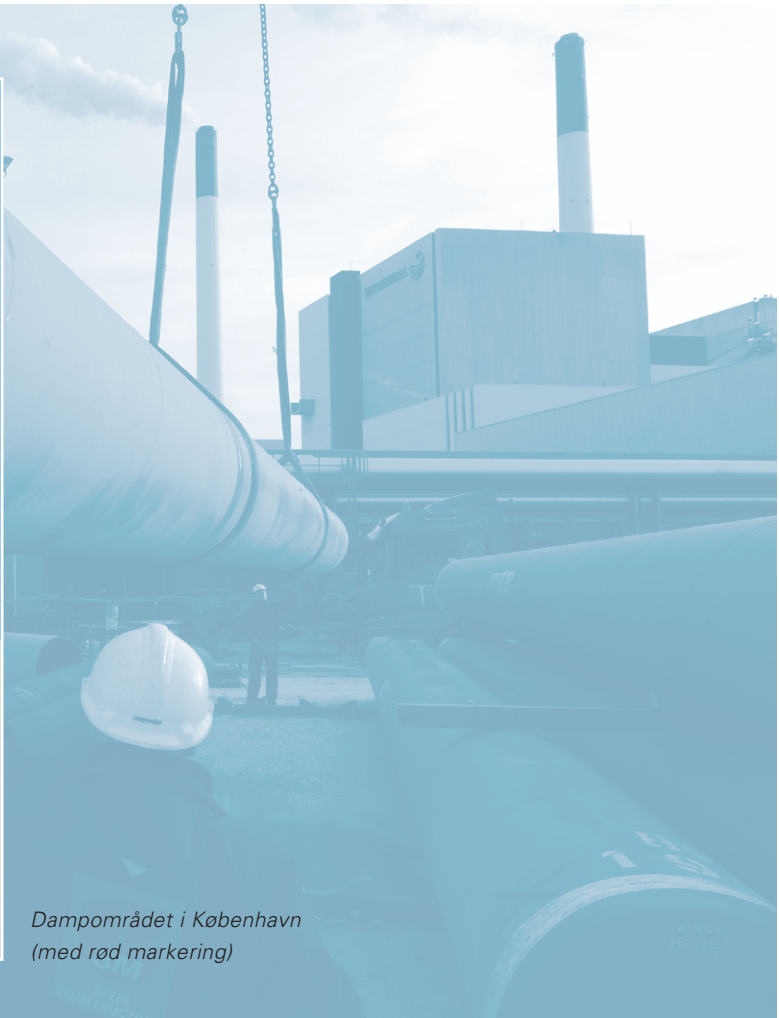
Dampområdet i København (med rød markering)