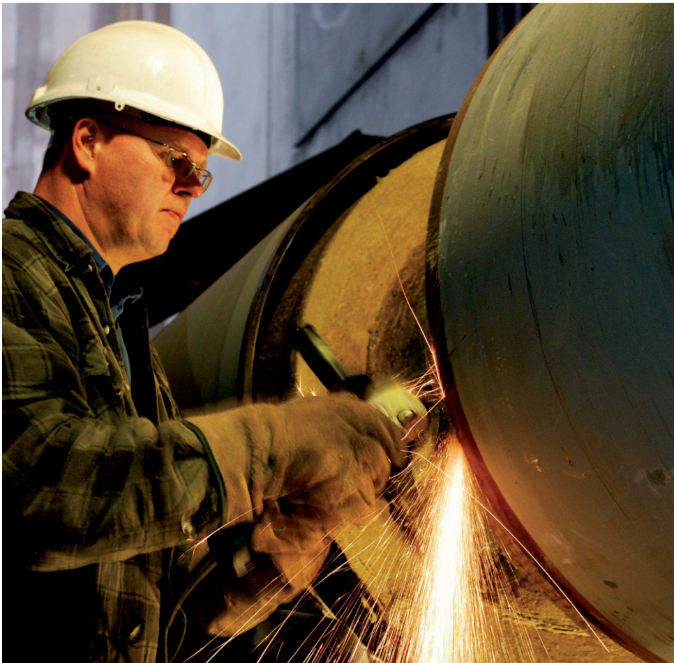
Rørene i Københavns Energis fjernvarmetunnel har betydelige dimensioner: 2 stk. 700mm, 2 stk. 500 mm og 2 stk. 400 mm rør.