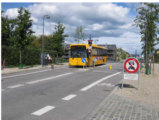
Foto 2. Dynamisk bussluse på Frederiksholmsbroen