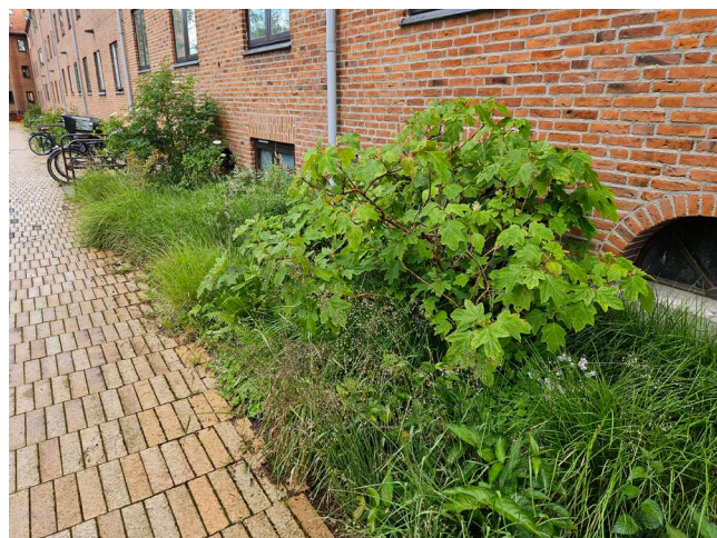
Inspiration til den fremtidige gårdhave, Beplantning ved facade

I gårdhaven etableres der en fælles affaldsløsning på tværs af gårdhavens matrikelskel. Affald, både for private og erhverv, placeres i to over-