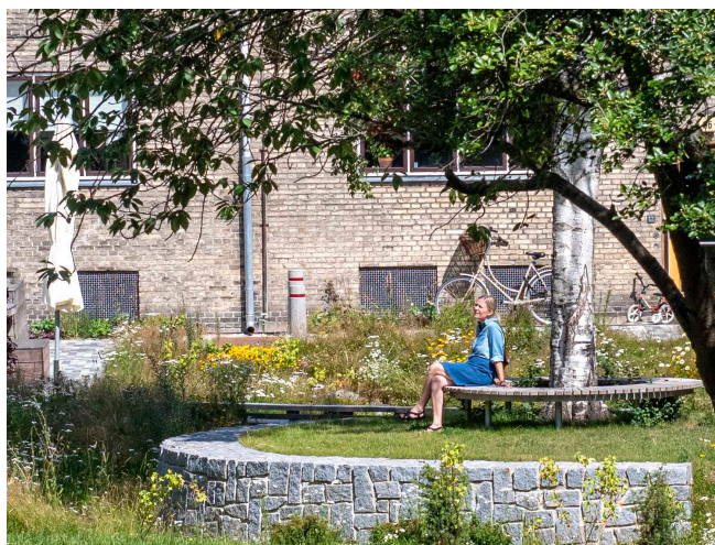
Inspiration til den fremtidige gårdhave, Cirkulært møbel

dækkede affaldsstationer. Affaldsstationerne bygges i træ, helst genbrugstræ, med en beklædning af lameller, der vil give mulighed for indkig og således øge trykthed omkring affaldsstationerne. Erhvervsaffald placeres i separat aflåste rum i affaldsstationerne.