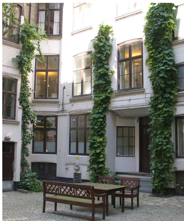
Inspiration til den fremtidige gårdhave, Facadebeplantning på wires

gårdens industriskorsten. Som udgangspunkt dækker projektets økonomi alle faste elementer i gården, som belægninger, beplantning, affaldsstationer, mv. Hvis projektet har økonomi til indkøb af flytbare møbler, vil gårdhaveprojektet også finansiere dette. Alternativt må gårdens kommende gårdlaug stå for anskaffelsen af møbler.