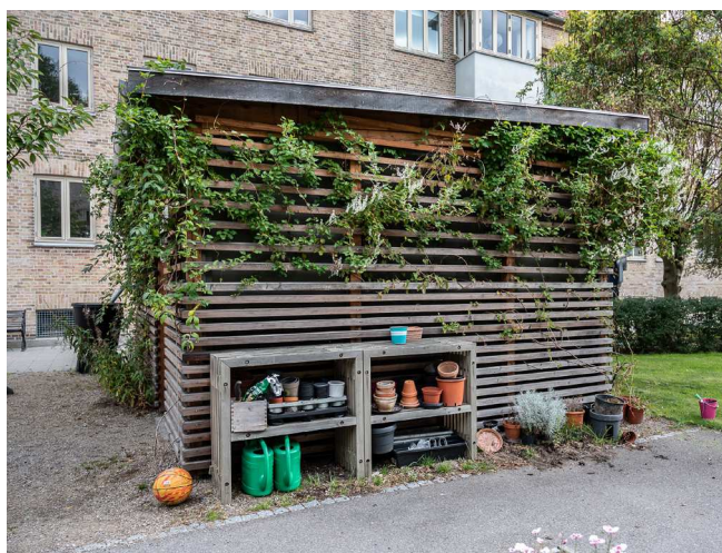
Inspiration til den fremtidige gårdhave

Grundet pladsmangel i gården vil der blive etableret færre cykelparkeringspladser end det antal, der er i gården i dag. Der etableres i alt 70 cykelparkeringspladser i gården. De fleste af cykelparkeringspladserne vil blive etableret i brandredningszonerne. Cykelparkeringspladserne i brandredningszonerne vil være af en model, hvor cyklerne ikke kan låses fast til stativet jf. kravene fra brandmyndigheden.