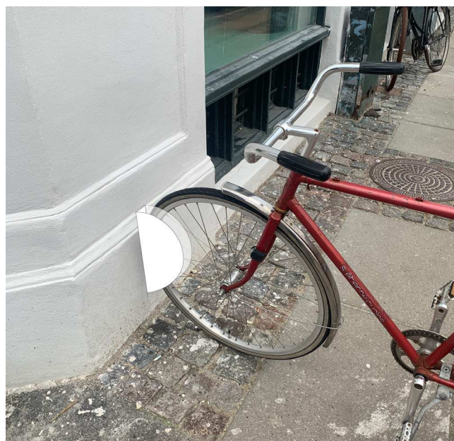
Inspiration til den fremtidige gårdhave, Cykelstativ Visualisering: Schulze Grassov

Høringsperioden og afstemningen varer frem til d. 19. august 2024, hvorefter det forelægges Teknik- og Miljøudvalget og Borgerrepræsentationen, som vil tage endelig stilling til, om der skal etableres en fælles