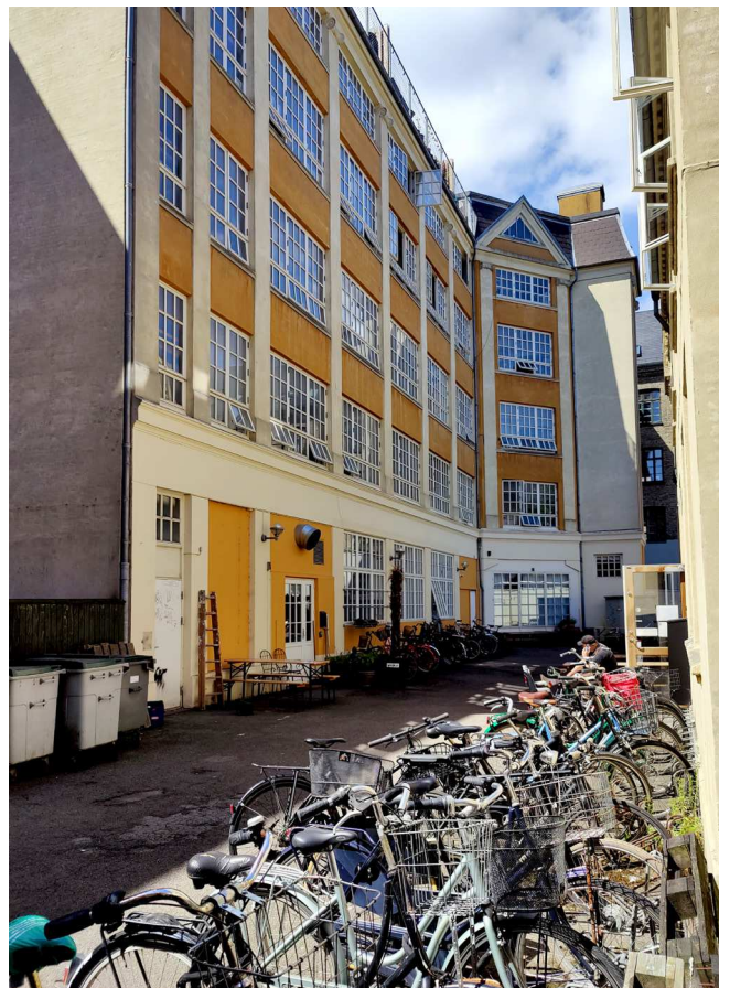
Eksisterende forhold

Beboere ønsker en gårdhave, der tager udgangspunkt i gården og kvarterets industrielle historie, hvor designgreb, materialevalg, stoflighed og farver indarbejdes i gårdens design. Designet vil således understøtte Nørrebros industrielle fortid og bygningers egenart. Gården skal imødekomme beboernes ønsker og Københavns Kommunes retningslinjer for opholdsarealer, affaldshåndtering og cykelparkering og samtidig omdannes til en stemningsfyldt oase midt på indre Nørrebro. Langs bygningerne lægges et bånd af genanvendte brosten, som fletter sig ind mellem en flot og funktionel belægning i betonfliser og teglklinter, der vil ligge i det resterende gårdrum og blive et samlende gulv. Det har været et ønske at reducere støjniveauet i gården. Derfor reduceres mængden af hårde belægninger, og der skabes plads til plantebede, hvor planterne vil have en støjdæmpende effekt. Farvevalget af de nye materialer vil forholde sig til facadernes lyse farver, og samtidig spille på gårdens industrielle fortid ved at inddrage blå - her lå nemlig fabrikken for virksomheden Glud og Marstrand, der bl.a. producerede det emaljerede køkkentøj, Madam Blå. Gårdens gamle industriskorsten fremhæves ved at lægge et cirkulært belægningsmønster omkring den. Ny beplantning i gården vil skabe rum for forskellige opholdszoner. Beplantningen vil bestå af træer, enkelte bede langs facaderne samt slyngplanter, der spændes op af bygningernes facader og affaldsstationer på wires.