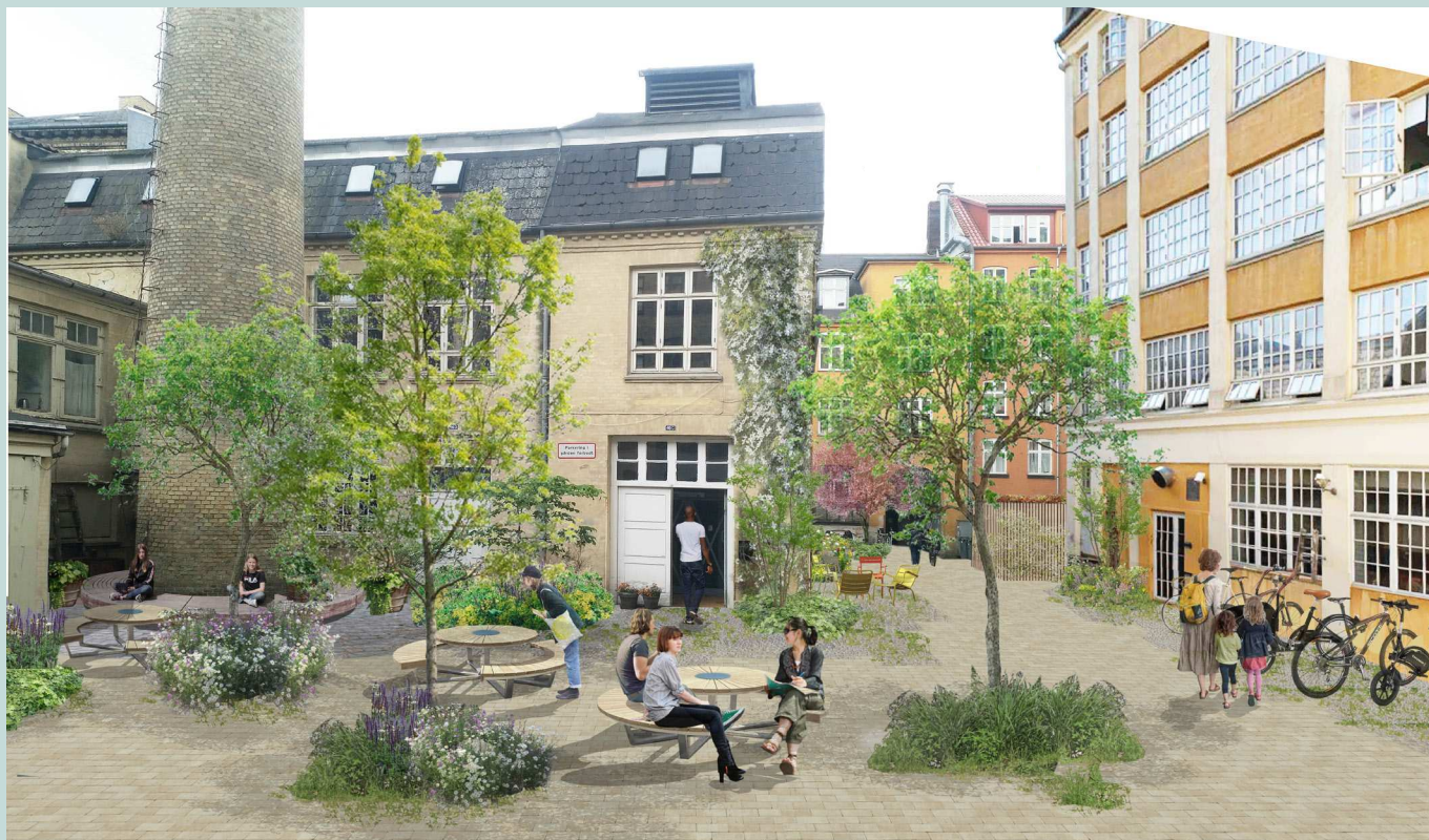
Visualisering af gårdhaveprojektet