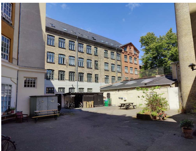
Eksisterende forhold

Eksisterende hegn, affaldsstationer, cykelparkering og belægninger vil blive ryddet og bortskaffet ifm. anlægget af den nye gårdhave.