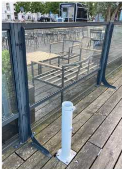
Montering af hegn og parasolfod