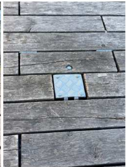
Dæksel over bøsningrør