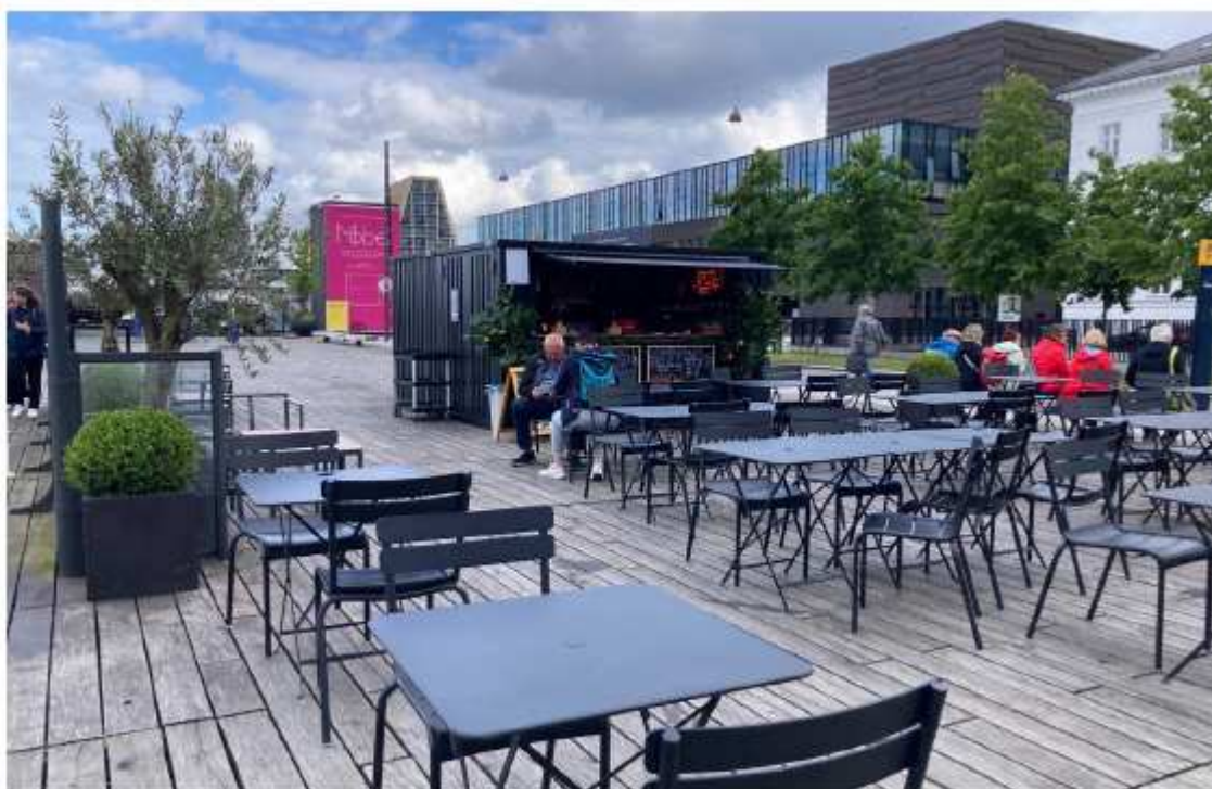
Foto hvor Caféen/baren er i funktion den 11. juni 2024