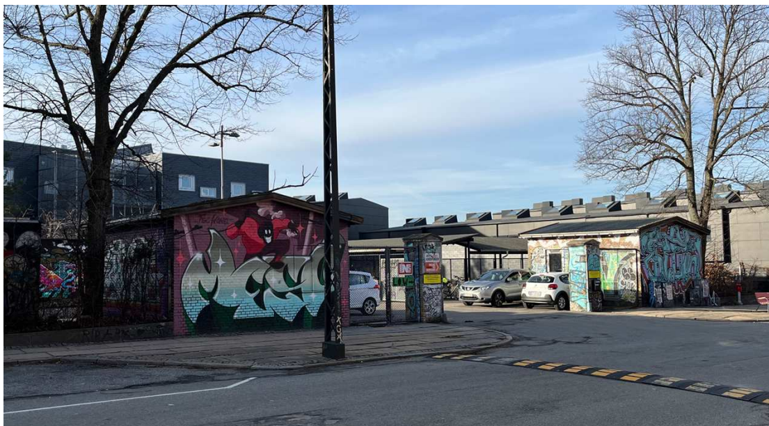
Bygning VIII – Portner- og vagtbygning ved indgang fra Ragnhildgade.

Samlet bevaringsværdi: Bygningerne vurderes til at være bevaringsværdige som enkle bygninger, der udgør en symmetrisk helhed, der yderligere er en del af et samlet bymiljø, og som med sine særlige funktioner er en del af stedets historie. Bygningerne er registreret med en middel SAVE-værdi på 6.