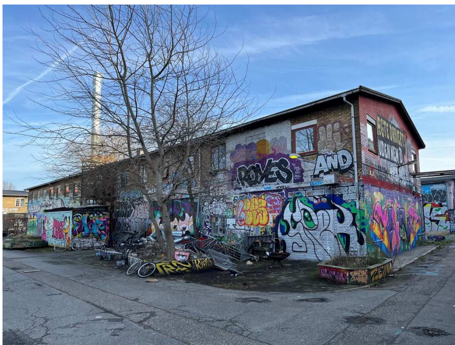
Bygning IV – Den midterste af de oprindelige tværgående bygninger.

Samlet bevaringsværdi: Bygningen vurderes til at være bevaringsværdig som tidstypisk brugsbygning, der er en del af et harmonisk bymiljø, og som med sine særlige funktioner er en del af kommunens historie. Bygningen er registreret med en middel SAVE-værdi på 6.