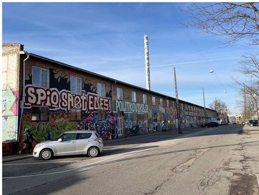
Bygning VII – Set fra Ragnhildgade.

Samlet bevaringsværdi: Bygningen vurderes til at være bevaringsværdig som en velproportioneret og tidstypisk bygning, der er en del af et harmonisk bymiljø, og med sine særlige funktioner er med til at tegne byens historie.