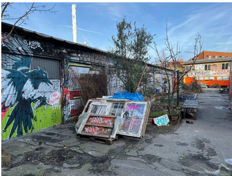
Bygning V, Garager – Set fra den vestlige del af området.

Samlet bevaringsværdi: Bygningen vurderes til at være bevaringsværdig som en tidstypisk brugsbygning, der er en del af et harmonisk bymiljø, og som med sine særlige funktioner er en del af kommunens historie.