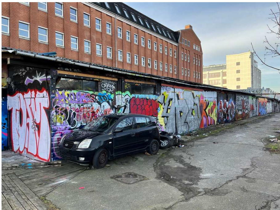
Skurbygning – Bebyggelsen af placeret i den vestlige del af området.

Samlet bevaringsværdi: Bygningen vurderes til at være bevaringsværdig som en brugsbygning, der afgrænser og er en del af et harmonisk bygningsmiljø, og som med sine særlige funktioner er en del af kommunens historie. Bygningen er registreret med en middel SAVE-værdi på 6.