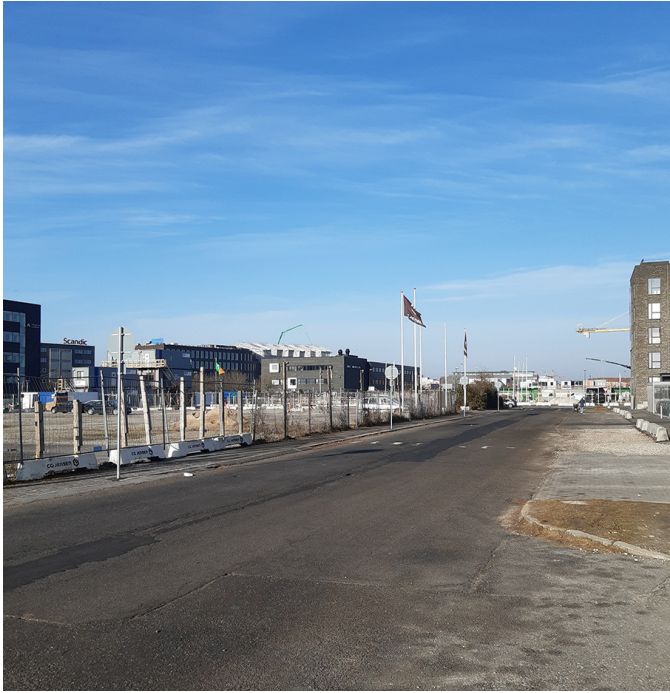
Ved Stigbordene set mod vest med lokalplanområdet til venstre i billedet.