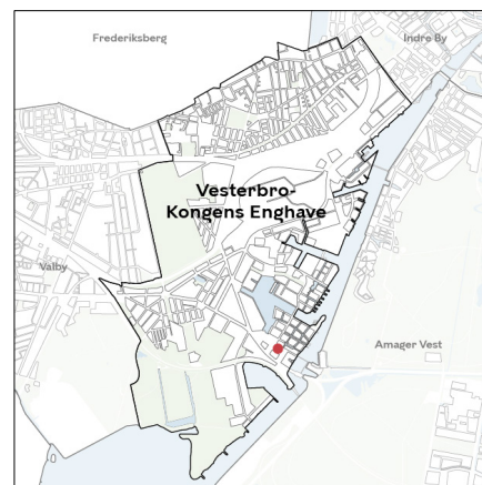
Områdets placering i bydelen.

Da lokalplanen ikke muliggør nye boliger, stilles der ikke krav om almene boliger.