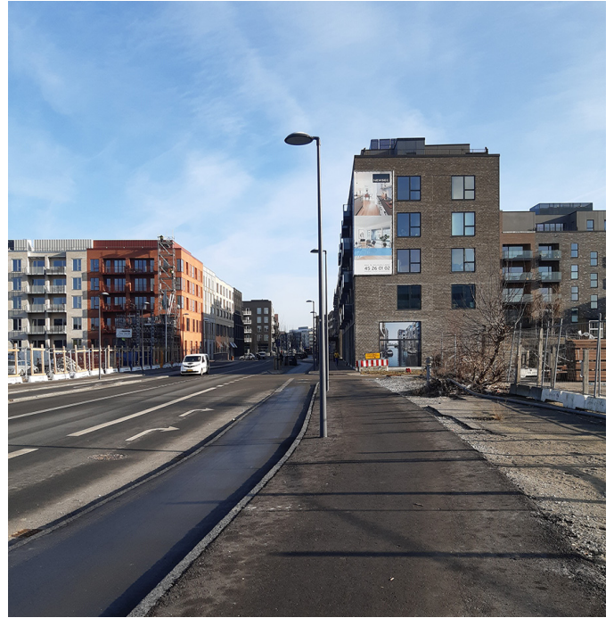
Sluseholmen set mod nord med lokalplanområdet til højre i billedet.