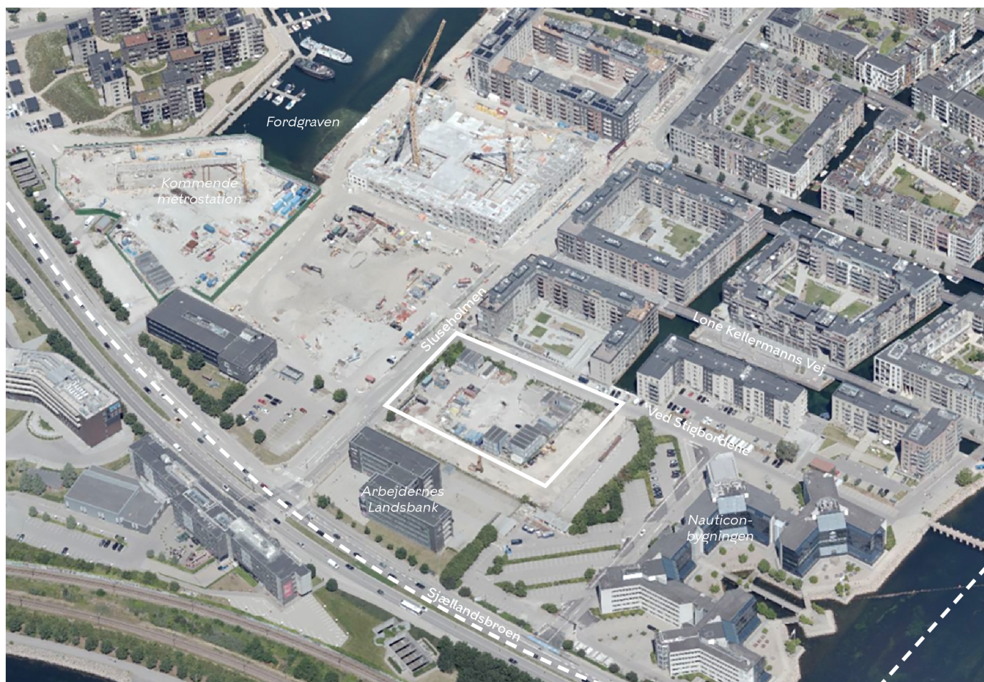
Området set mod nord. Lokalplan 310 er indtegnet med hvid, stiplede linje, området for tillæg 13 er indtegnet med hvid linje, og de vigtigste gader, pladser og bygninger er navngivet. Luftfoto: Kortforsyningen, 2019.