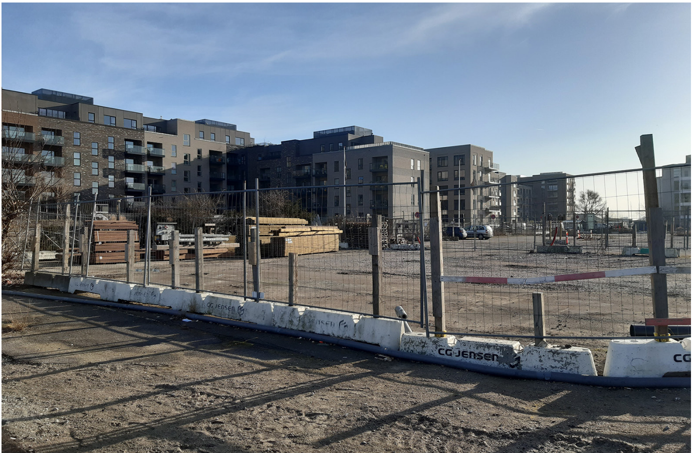
Byggegrund for byggefelt Q (syd) set mod nordøst.