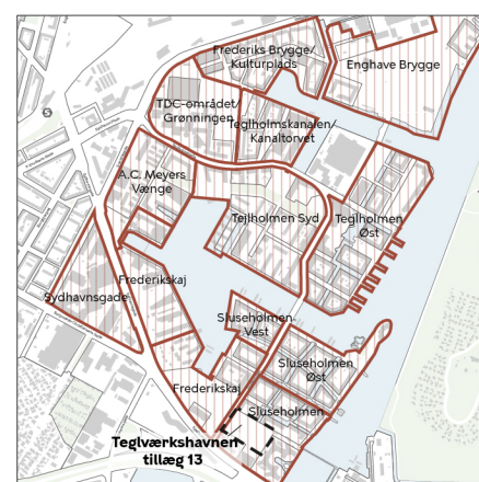
Gældende rammer i Kommuneplan 2019