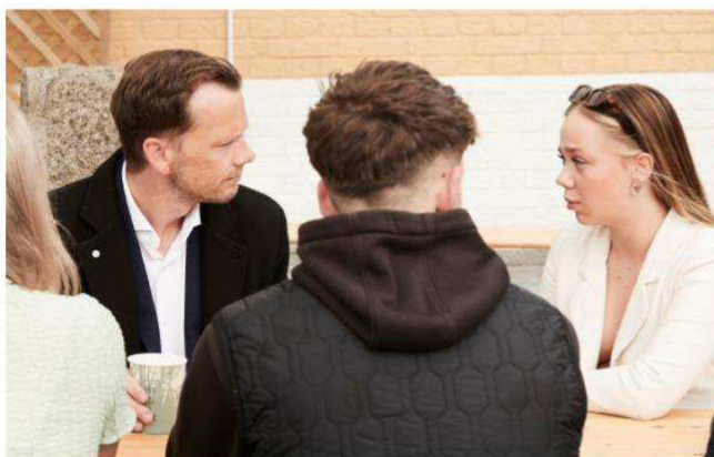
Foto fra Folkemødet i juni 2024.

Hvert år åbner Orðskælv et fortællerum og sætter fokus på en vigtig samfundstematik, som unge belyser med egne erfaringer og egne ord. Vores seneste Orðskælv-udgivelse er 'Kh Børnene', som udkom i september 2024. Bogen blev anmeldt af justitsminister Peter Hummelgaard, der gav udgivelsen 6 stjerner i Altinget og skrev: 'Den fortjener at blive læst af enhver med et hjerte, der banker.' 'Kh Børnene' blev af Altinget udråbt som en af de 10 bedste politiske bøger udgivet i 2024.